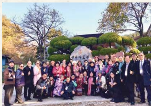
韓國大田聖山修道院