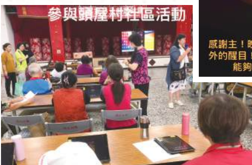
參與頭屋村社區活動