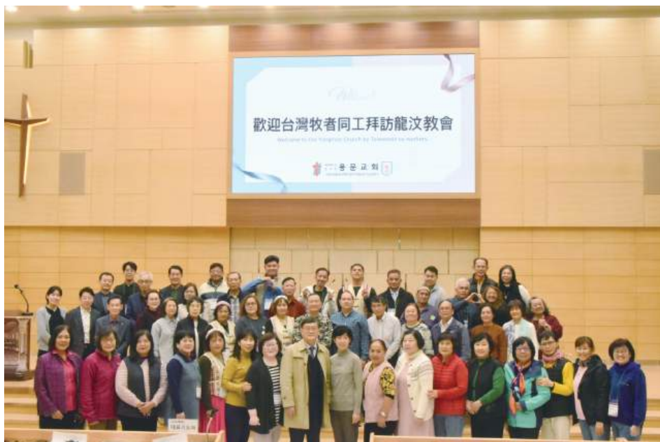
參觀大田龍汶教堂新堂

誰是忠心有見識的僕人，為主人所派，管理家裏的人，按時分糧給他們呢？主人來到，看見他這樣行，那僕人就有福了。 馬太福音二十四章45-46節