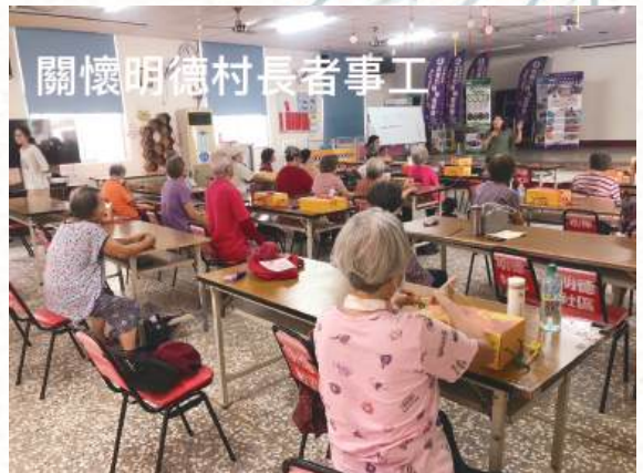
關懷明德村長者事工