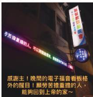
感謝主！晚間的電子福音看板格 外的醒目！願勞苦擔重擔的人， 能夠回到上帝的家～