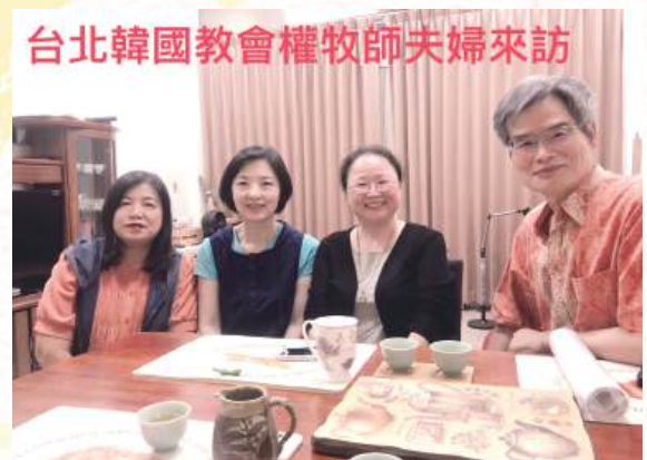
台北韓國教會權牧師夫婦來訪