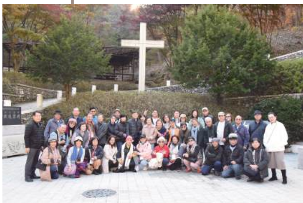
韓國基督教殉道者紀念館