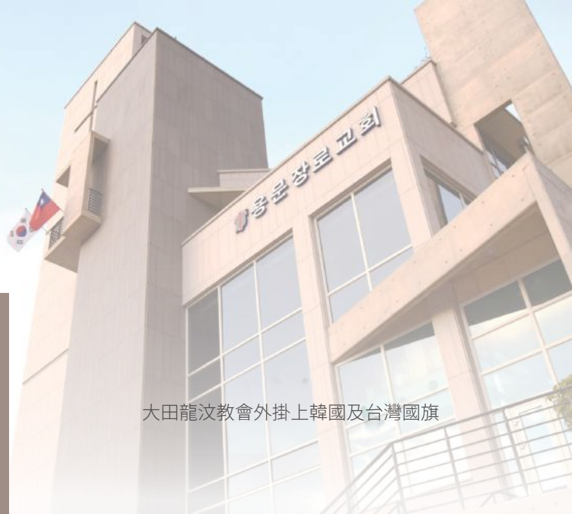
大田龍汶教會外掛上韓國及台灣國旗