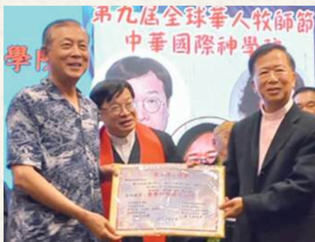
榮獲榮譽神學博士學位