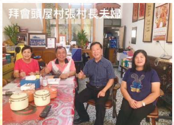
拜會頭屋村張村長夫婦