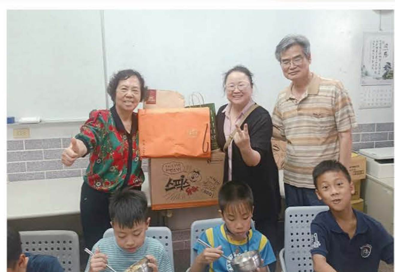
1130616 韓國牧師夫婦贈送糖果