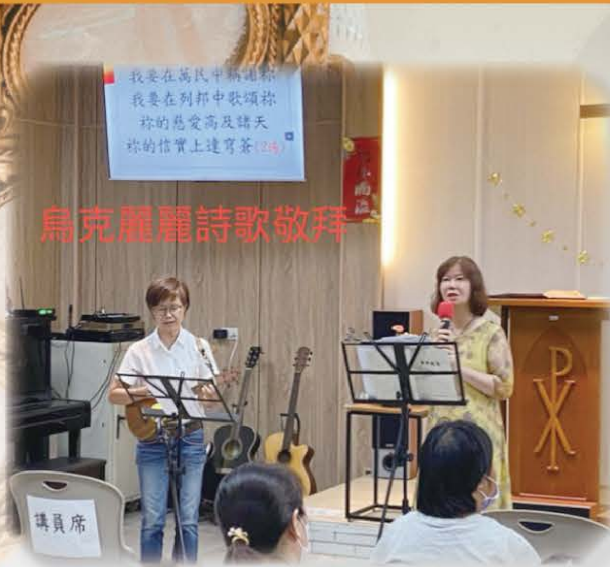
用絲弦的樂器讚美他