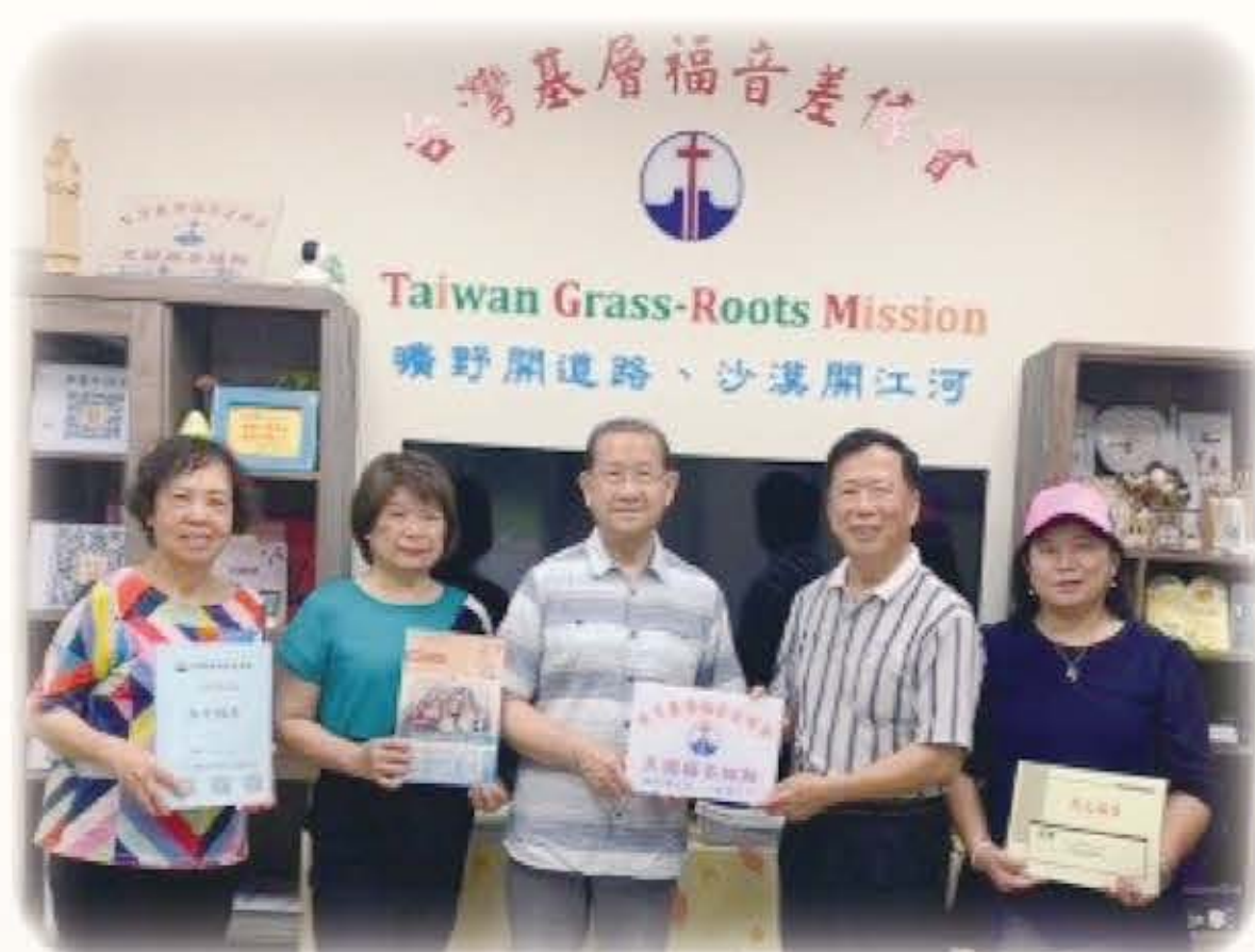
加州康郡余萃平牧師夫婦

3. 感謝主，目前基福已在各地設立 24 個「天國福音據點」，基福盼望和有相同異象與使命的教會及機構，成為合作之宣教夥伴，大家同心合一，廣傳福音，不斷建立新的據點，一起拓展神的國度。