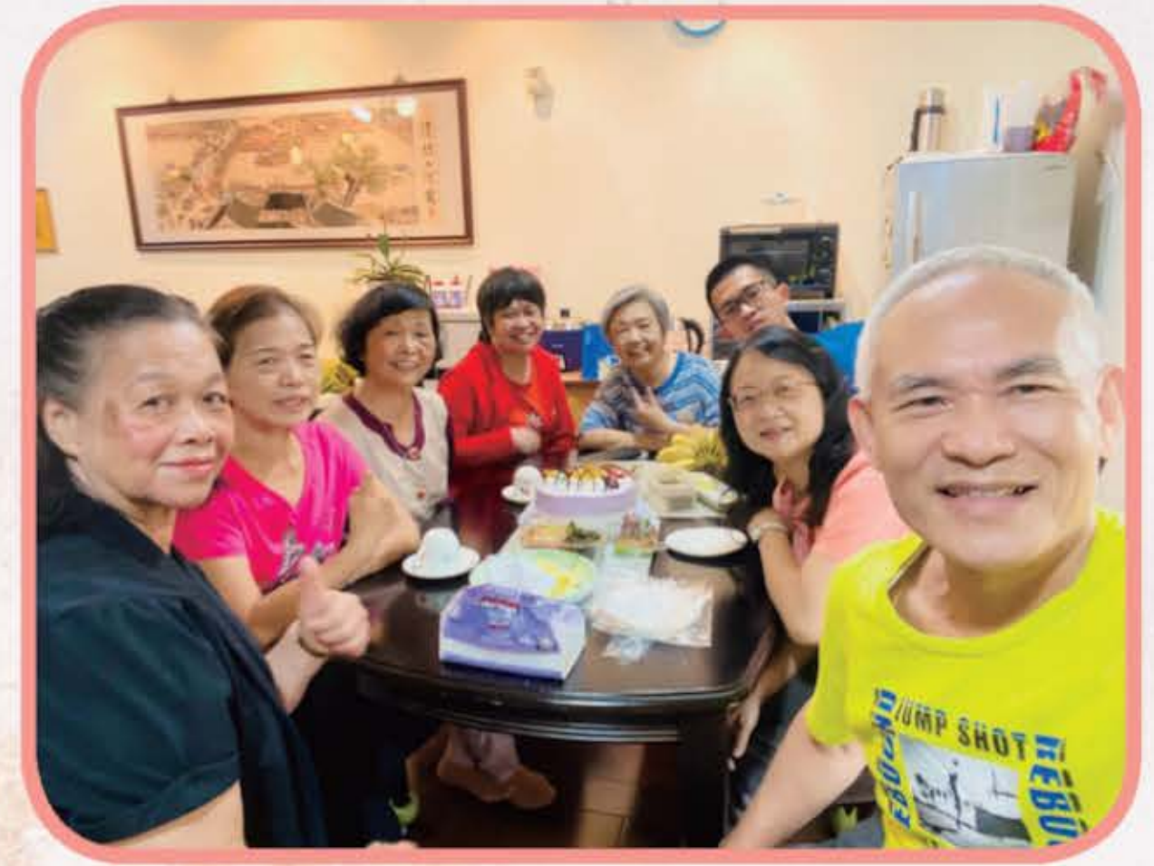
2024.6.9 與真理造就班的同工們 到台北探望關心俞媽