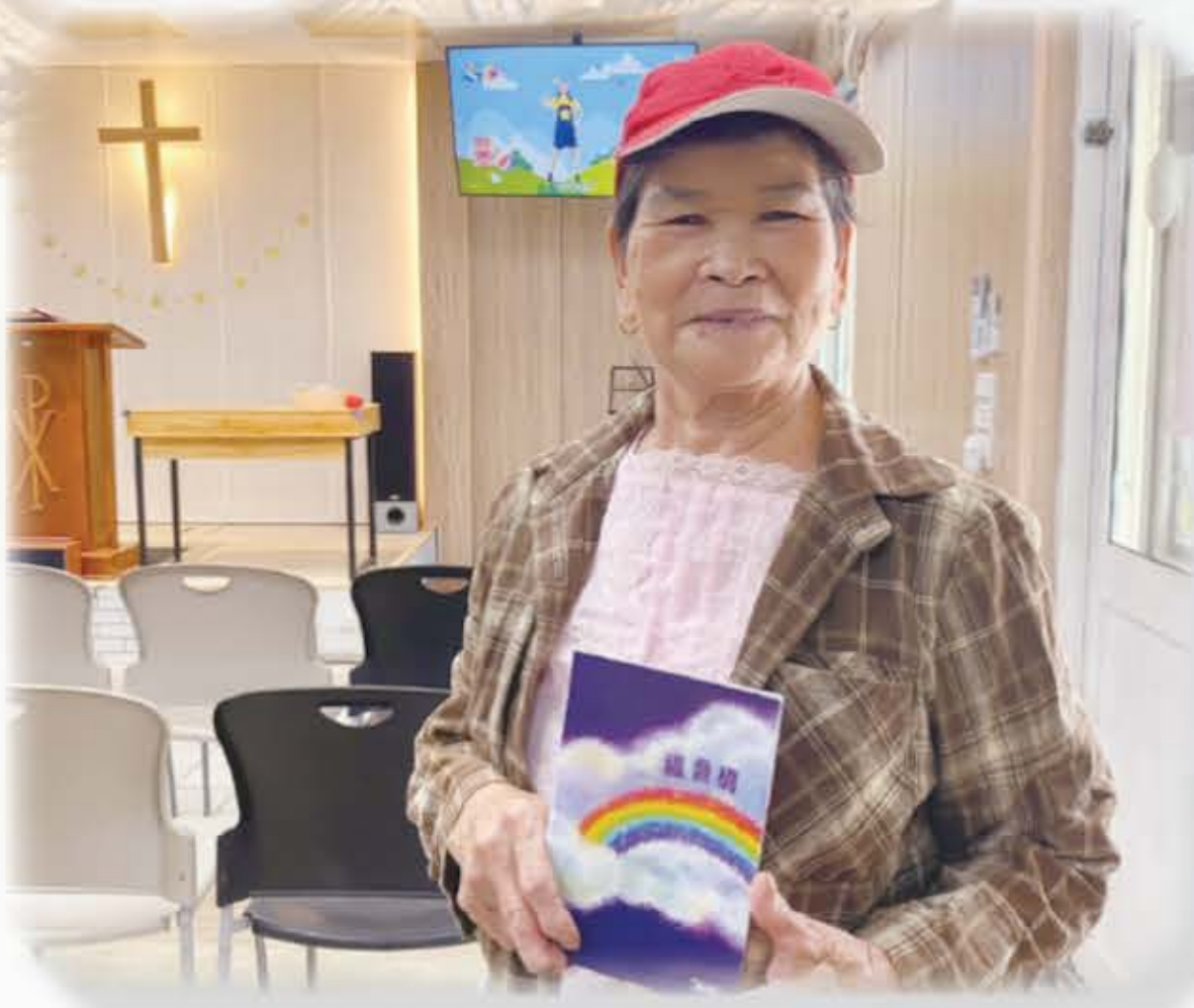
帶領阿媽看福音橋