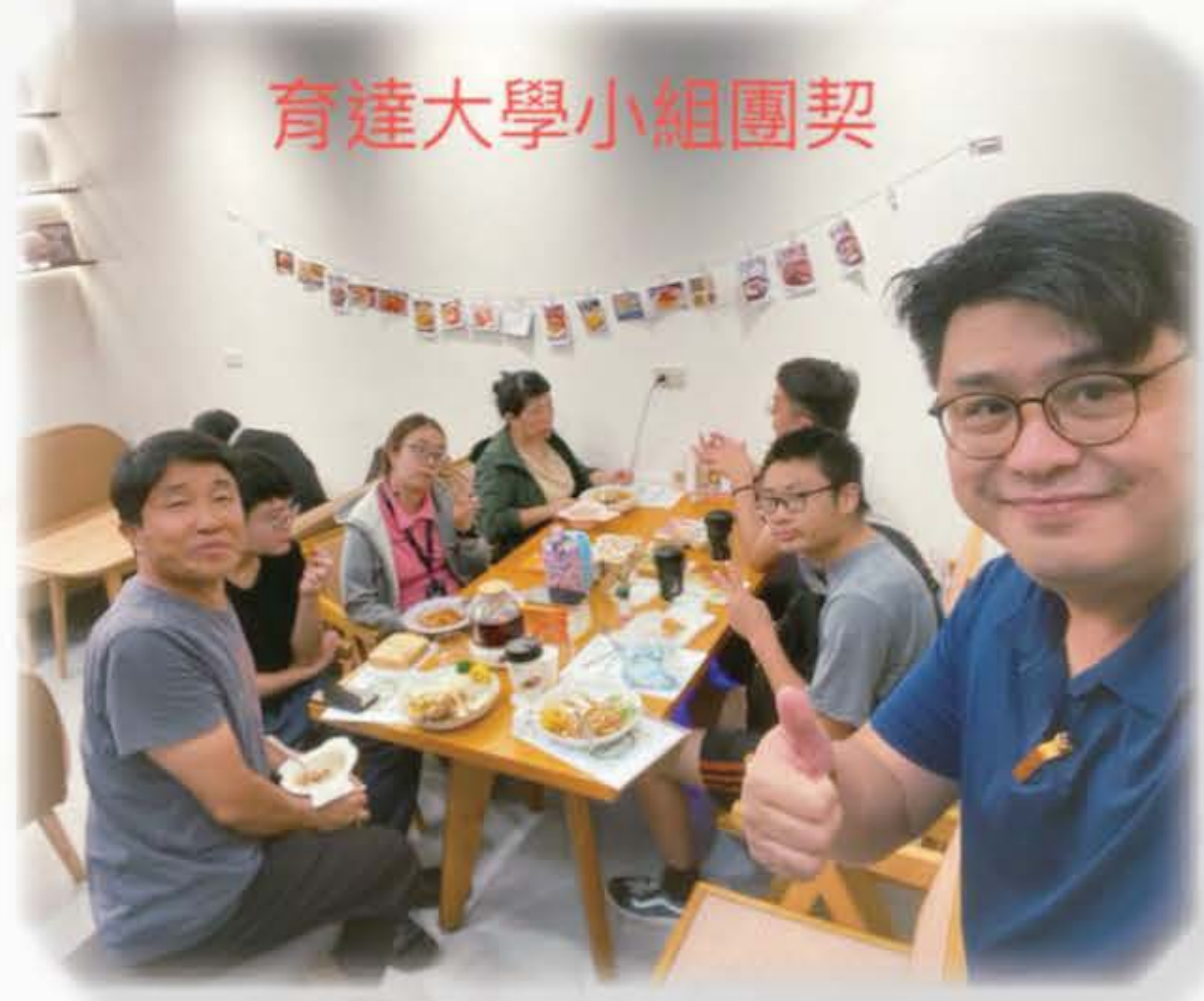
育達大學小組團契