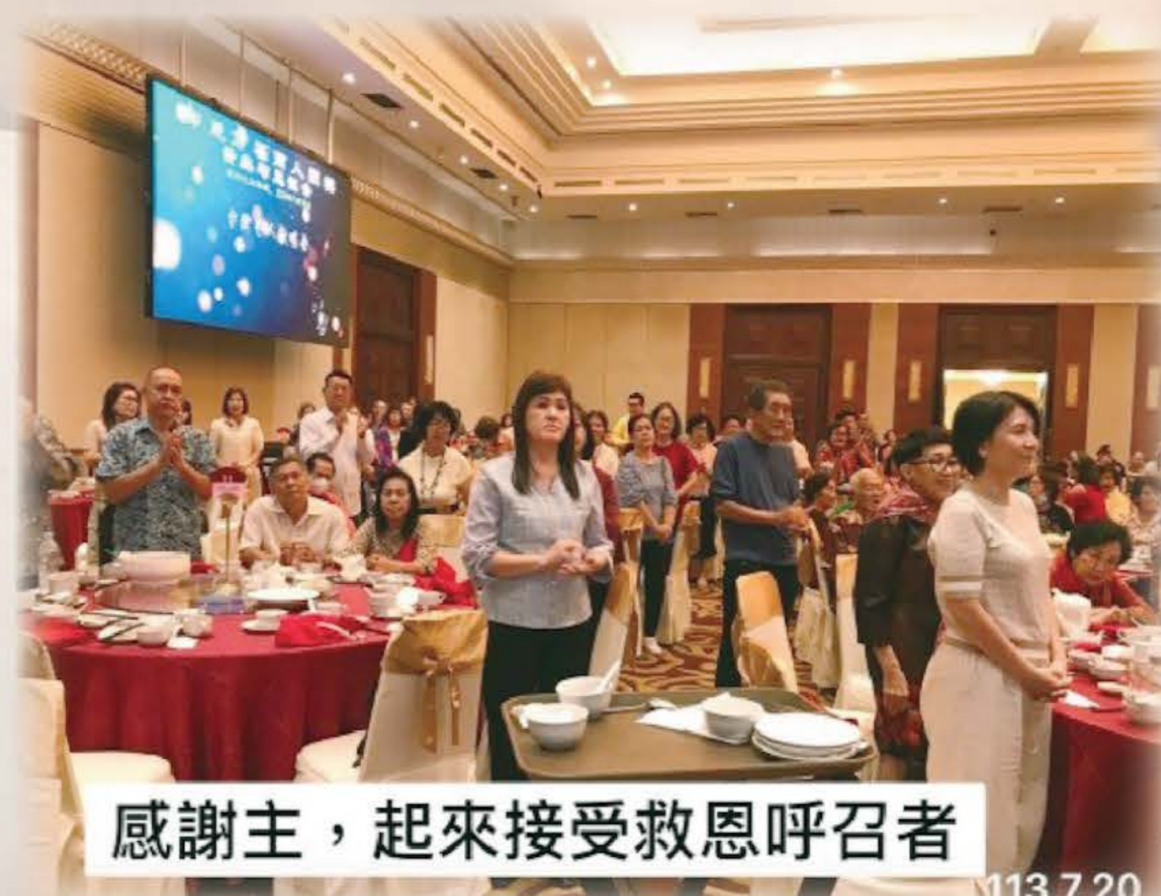
感謝主，起來接受救恩呼召者

感謝主！今年七月 19 至 31 日，我們的生命之歌佈道團，前往印尼雅加達、加里曼丹之坤甸、山口洋、等地舉行詩歌佈道大會，帶動當地華人及客家教會屬靈的更新，以及對福音宣教，領人歸主的熱誠。