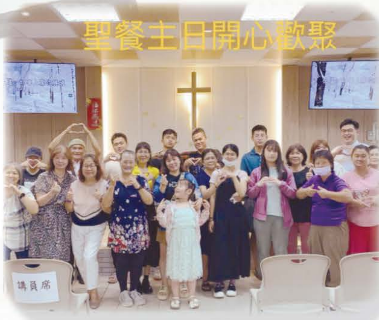
聖餐主日開心歡聚