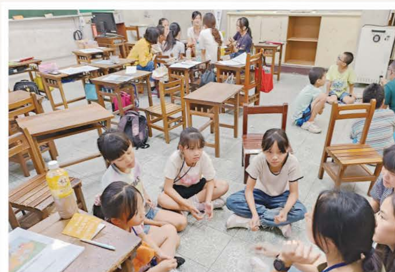
1130714 孩子們很乖巧可愛