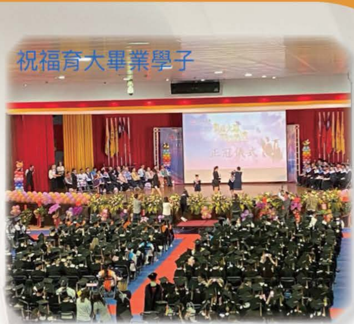
祝福育大畢業學子