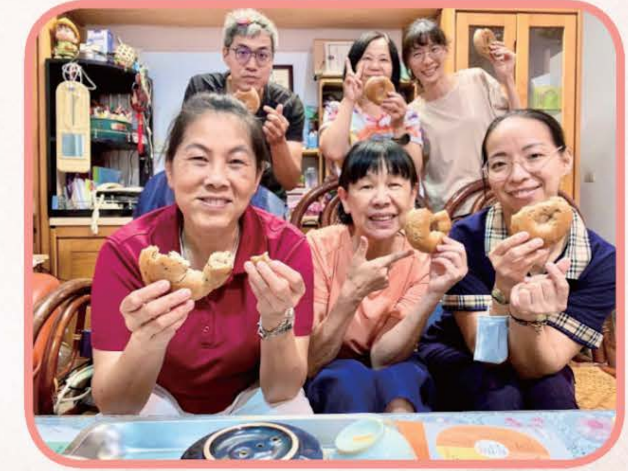
2024.8.4 愛家小組隔週三歡樂聚會