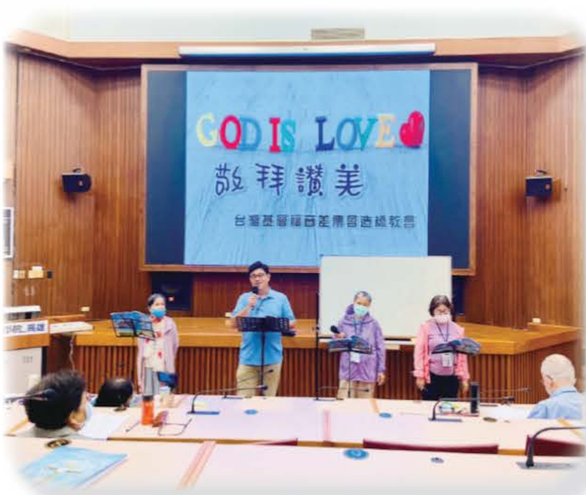
福音聯盟帶領敬拜讚美