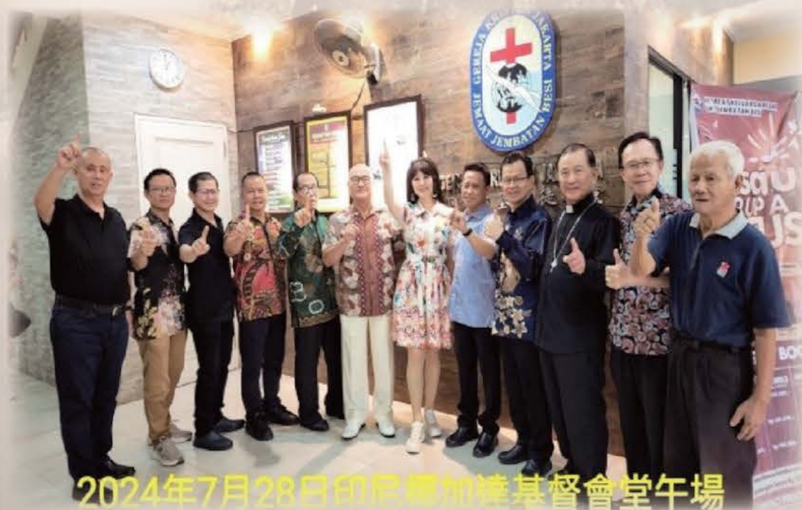
2024年7月28日印尼雅加達基督會堂午場

感謝主，基福的異象是在曠野開道路，在沙漠開江河！不分族群、不分語系，來傳揚神國的福音，引領更多浪子回頭，讓拜偶像的來認識主，唯有耶穌是我們生命的主宰。我們也進入監獄、走入社區、探訪醫院、派入工廠，到各處去藉著詩歌佈道、見證，領人歸主，帶來靈性的更新，讓他們能為主而活、為耶穌打那美好的勝仗！