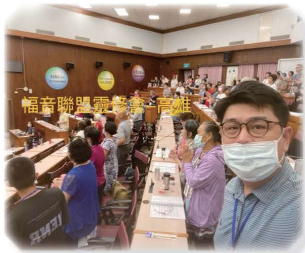
福音聯盟高雄澄清湖靈修會