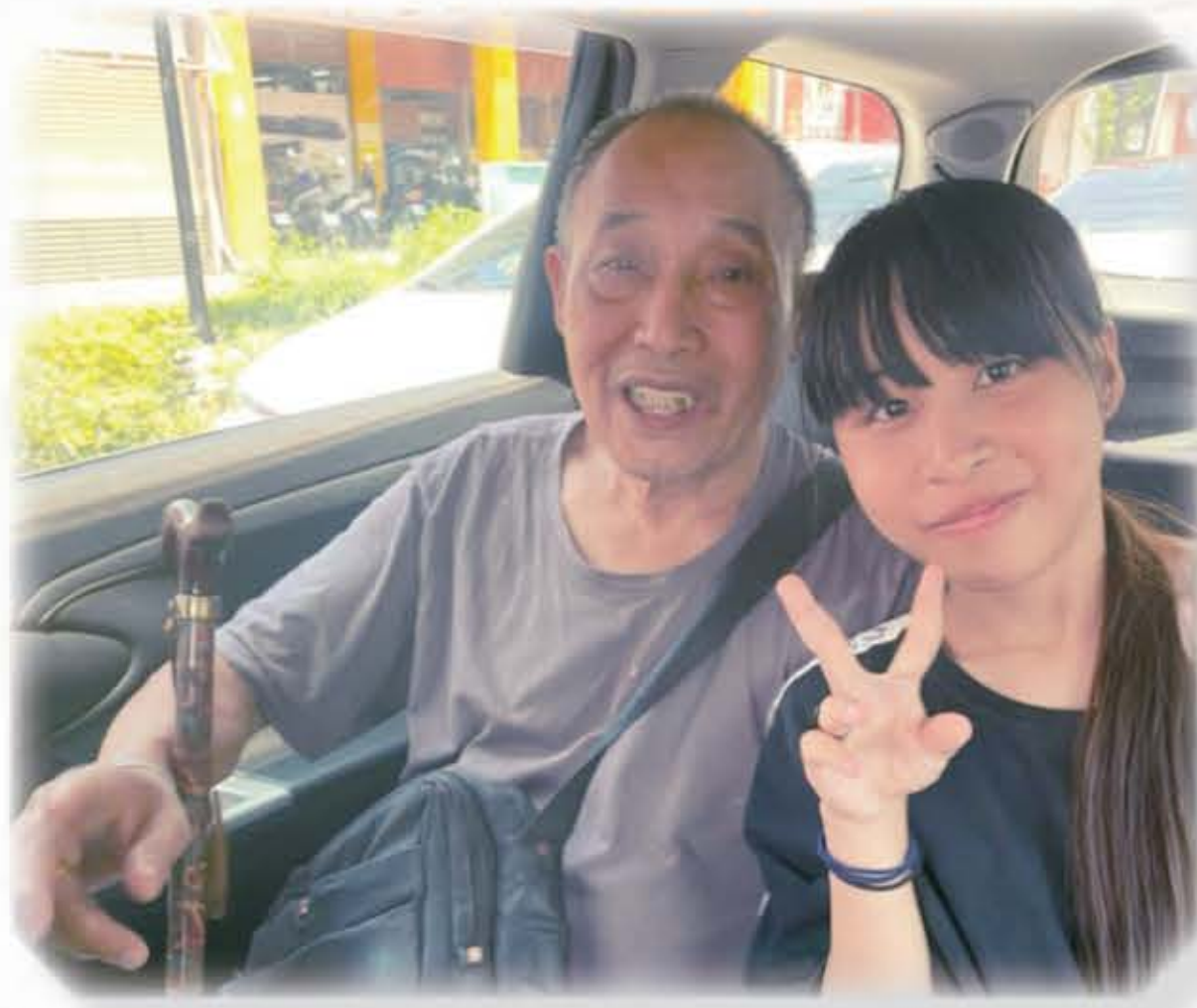
關心風爺爺家庭身體