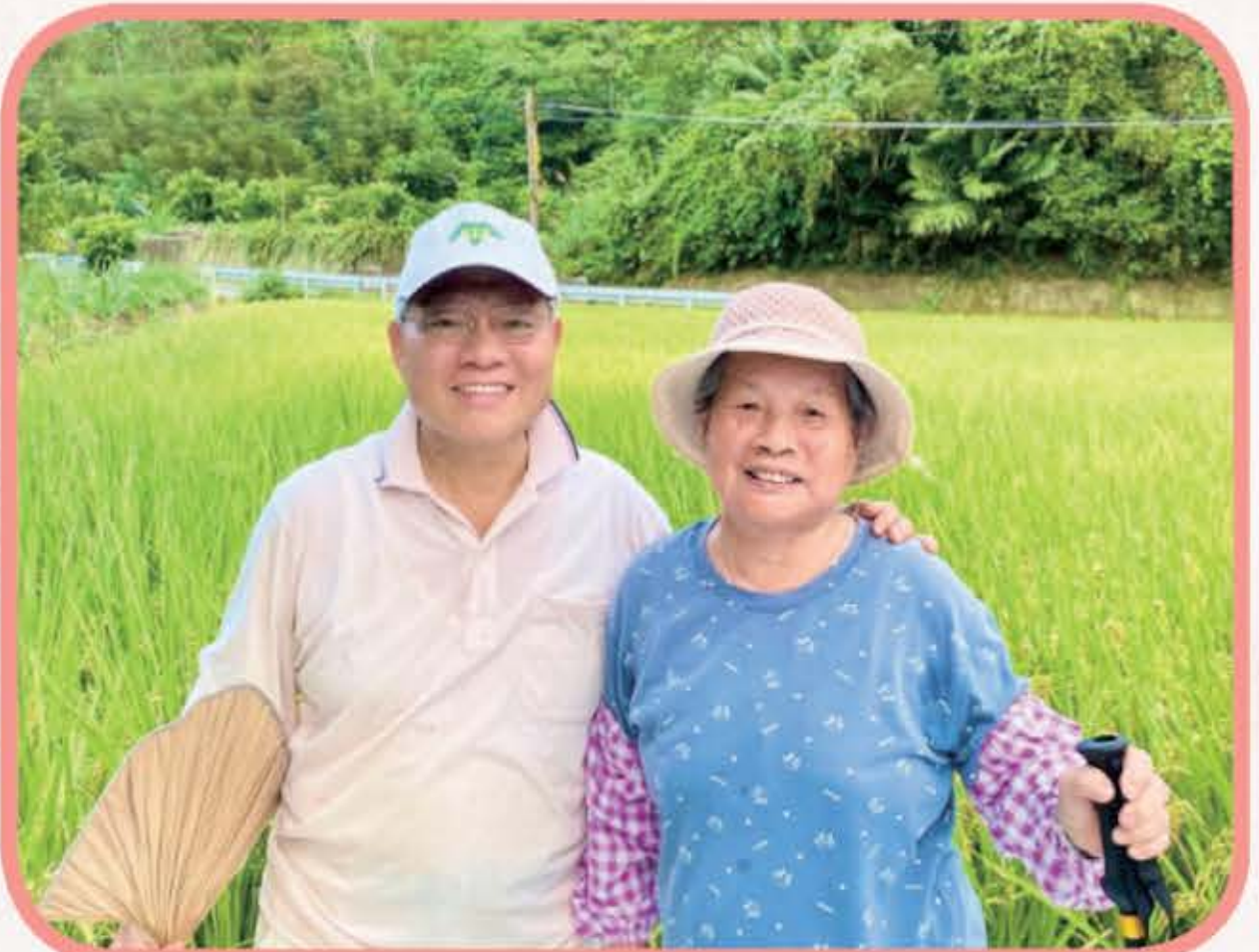
2024.7.7 會弟兄事親至孝全心照顧 已 94 高齡的母親