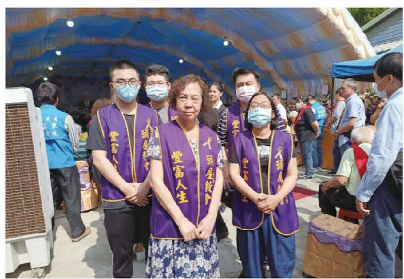
1130428 參加鄉長父親告別式