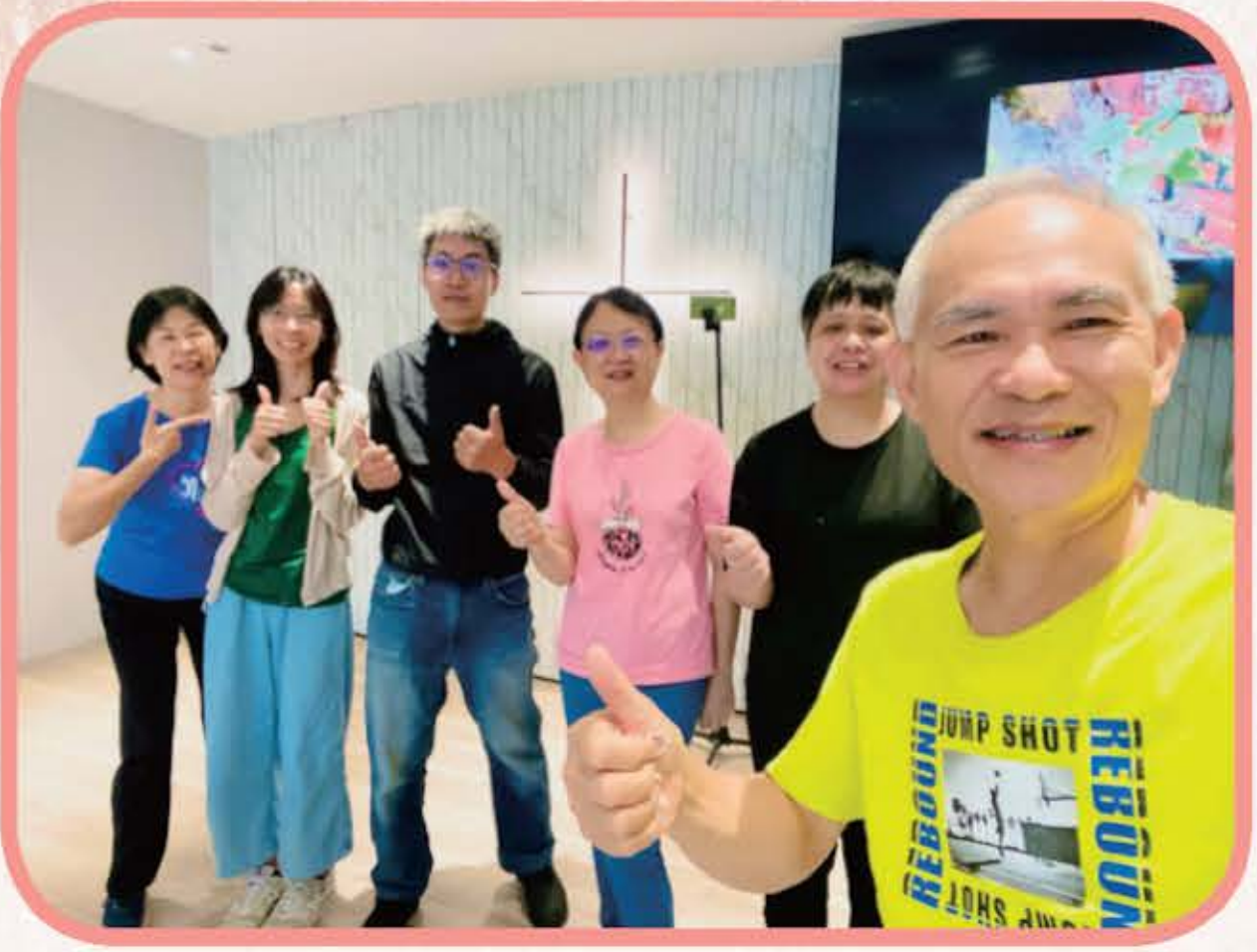
2024.6.9 弟兄姐妹們參加週二到週六 早上的耶利哥晨禱