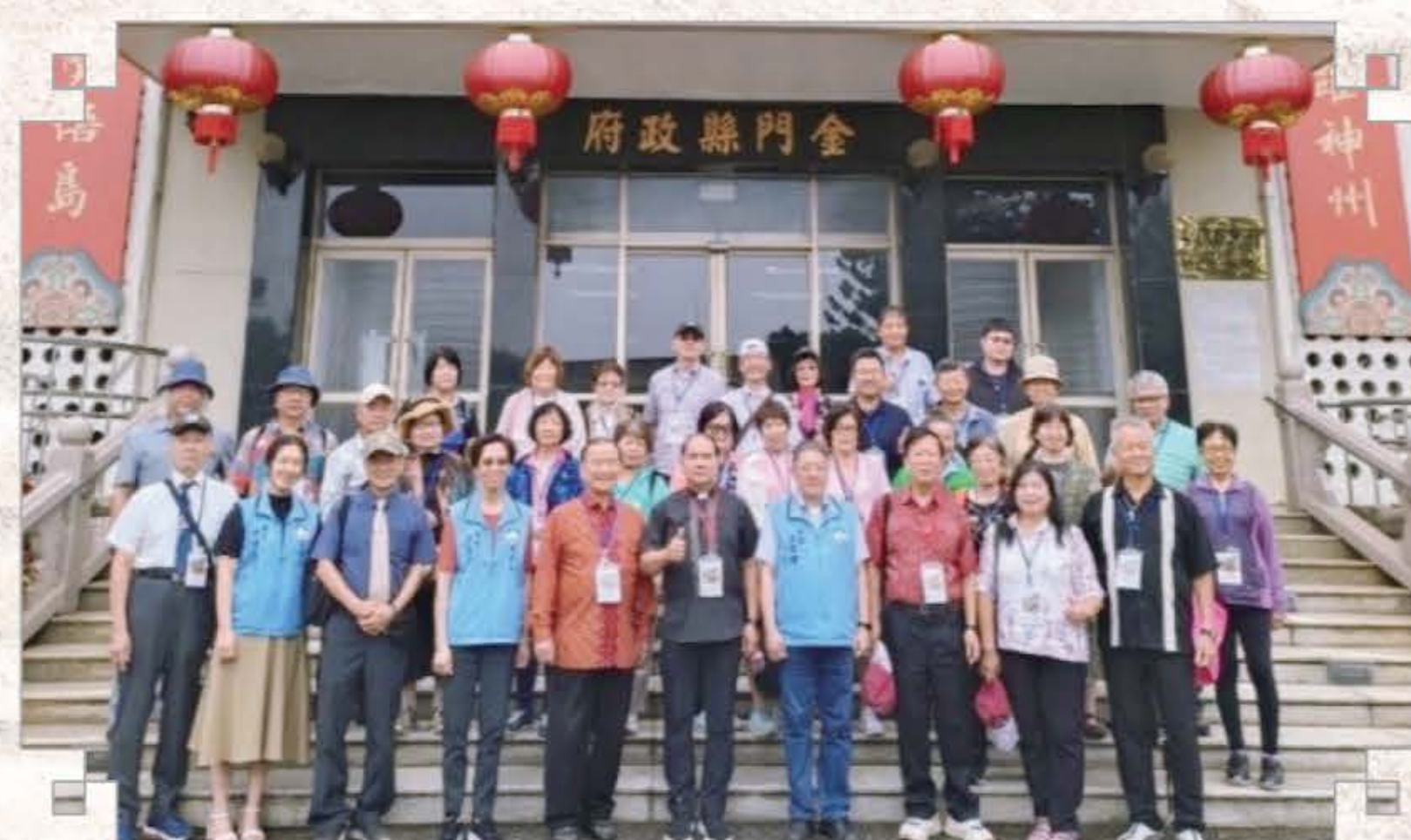
台灣使命者團隊訪問金門縣政府

也與其他社團合作，如：閩聲愛樂協會和金福 社教協會，透過音樂會和籃球營傳福音。支持基甸會、讀經會、基督教會協會等團體 推展讀經、贈經宣教、教會連結等工作。參加金門聯禱會活動與公部門活動，曾邀華人真道福音劇團演出，齊一心志傳揚福音。支持弱小教會與福音機構。籌組成立「金門縣恩泉關懷協會」，聚焦向銀髮族 傳福音（金門縣長住人口約 6 萬，老人人口 1 萬多人，約五分之一）。請大家為金門關心代禱，推動福音外展與社會關懷事工，使昔日金門的戰地，成為福音宣教之地。