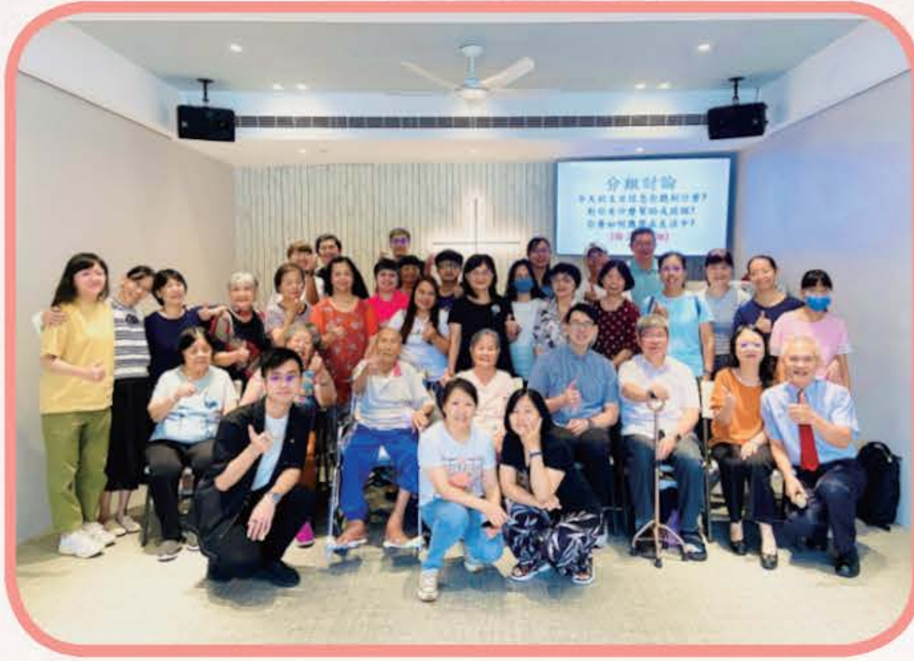
2024.6.9 會乾森爸爸在有生之年得見教會新堂 的裝修完成，並與弟兄姐妹及新竹北門聖教會 多多牧區喜多小家同工們合影留念