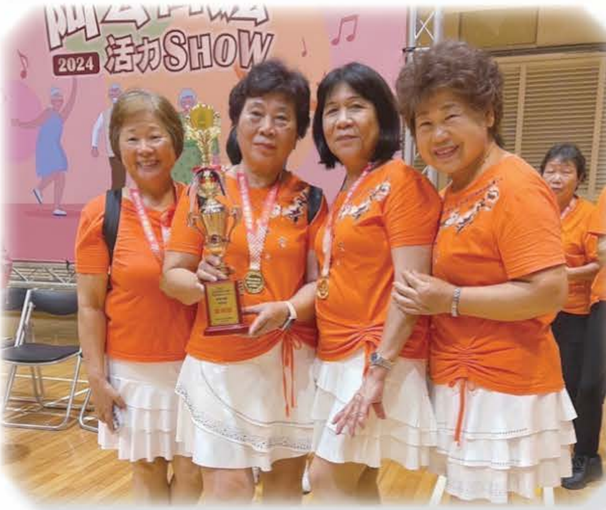
潘姐妹參與造橋朝陽團體獲獎