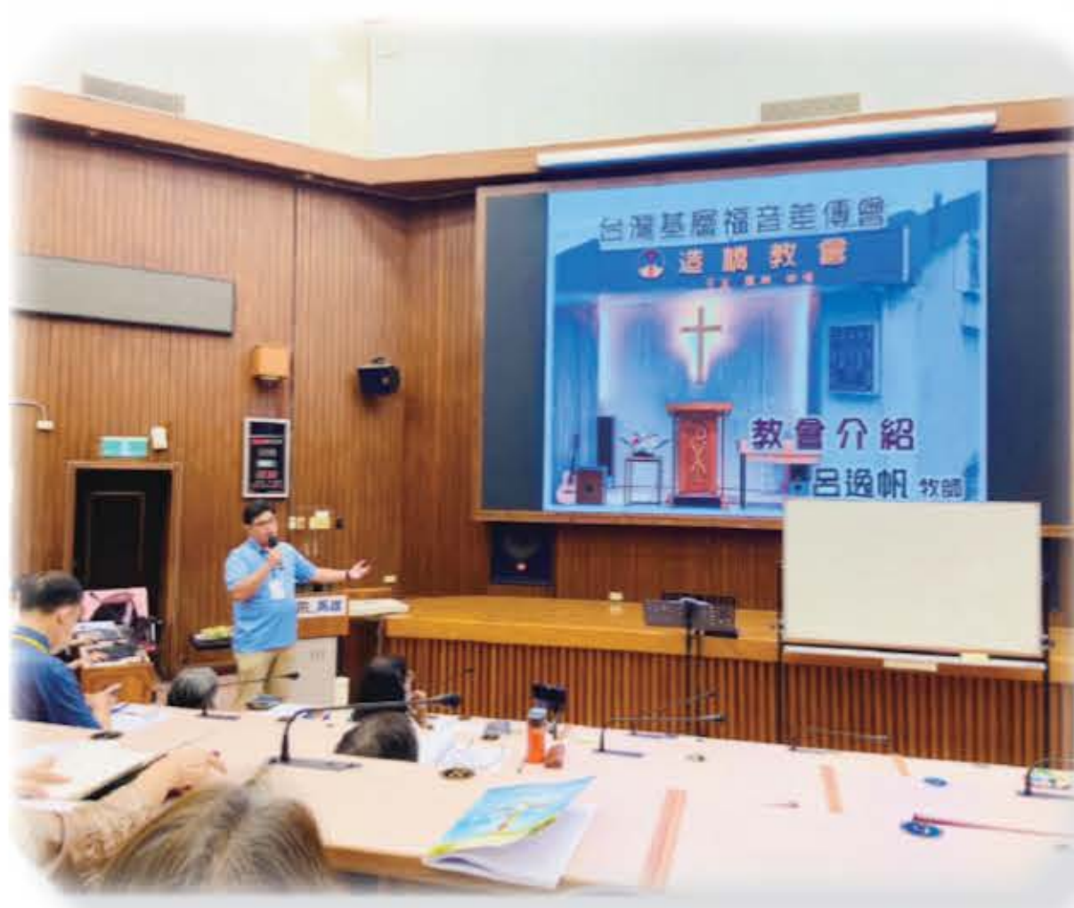
福音聯盟靈修會介紹基福及教會