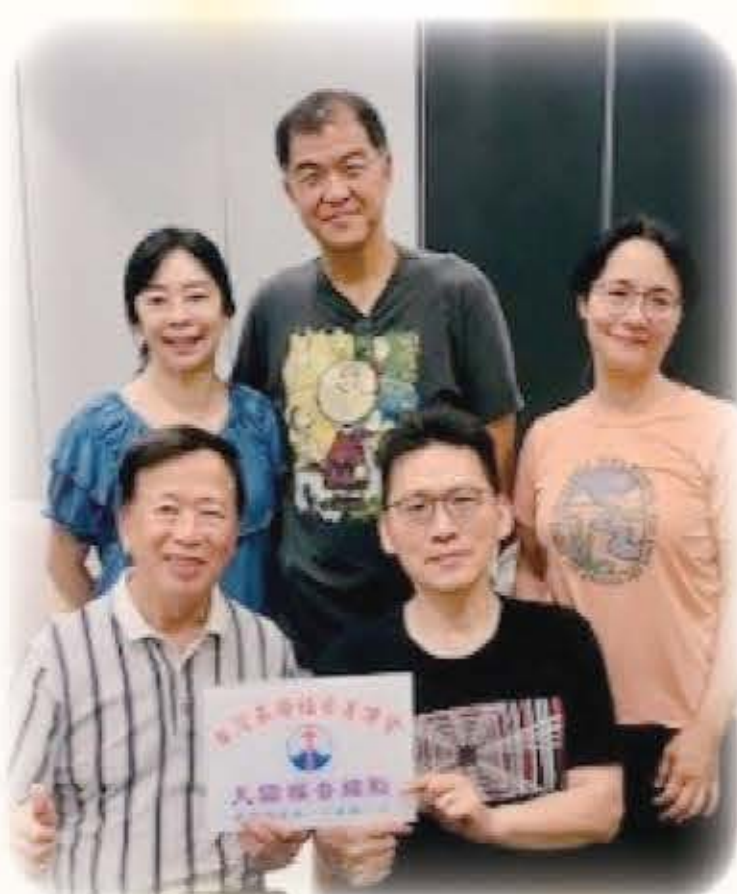
加州南灣亨利牧師