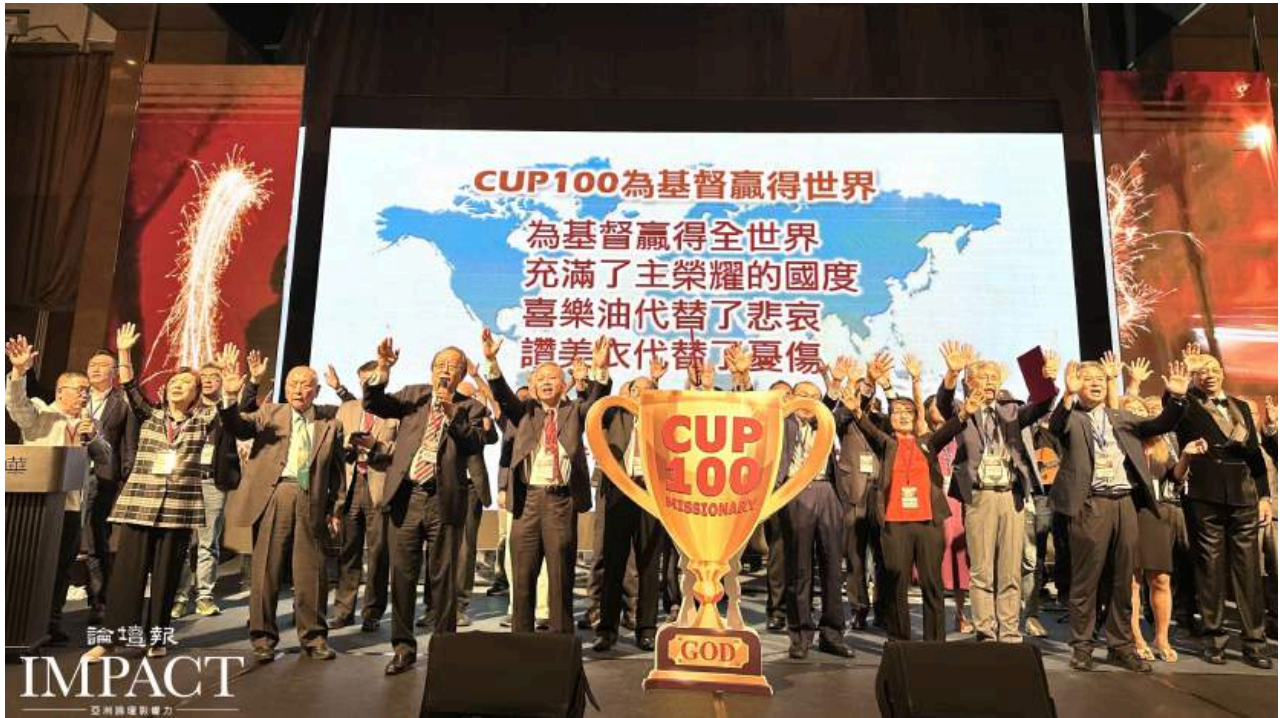
中華民國基督教會協會70週年慶宣示建造宣教士計畫。