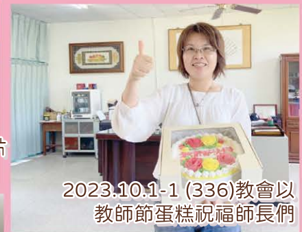
2023.10.1-1 (336)教會以 教師節蛋糕祝福師長們