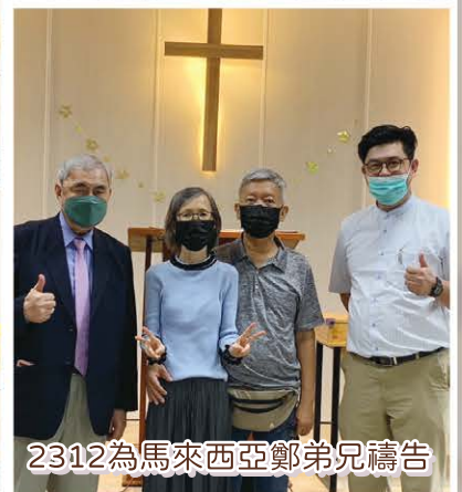
2312為馬來西亞鄭弟兄禱告