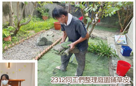
2312同工們整理庭園鋪草皮