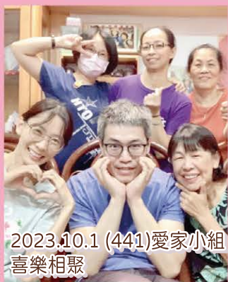
2023.10.1 (441)愛家小組 喜樂相聚