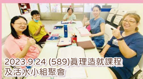
2023.9.24 (589)真理造就課程 及活水小組聚會