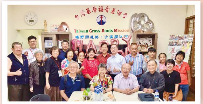
同心合一興旺主福音

1992年，感謝宇宙光全人關懷中心為峨眉送炭，基福另外成立中華大愛社會服務協會〔後中華改名為台灣〕。送發票給孫越叔叔籌建『天倫館』關懷老人兒童事工，並於1998年3月落成啟用。峨眉教會就搬進館內聚會。