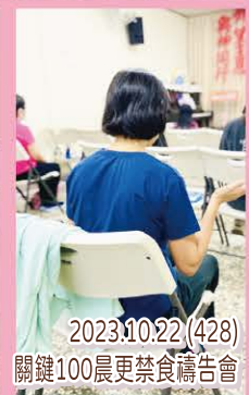
2023.10.22 (428) 關鍵100晨禁食禱告會