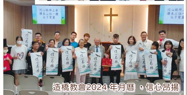
造橋教會2024 年月曆，信心昂揚