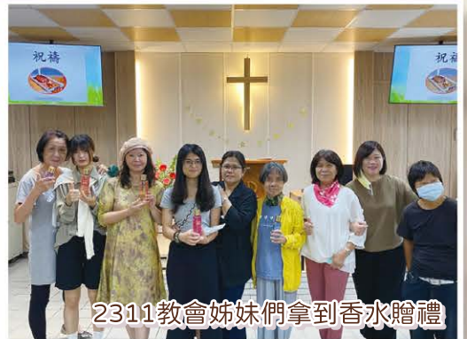
2311教會姊妹們拿到香水贈禮