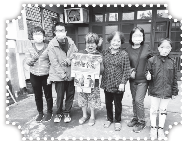
▲以相片福音月曆關心村民。