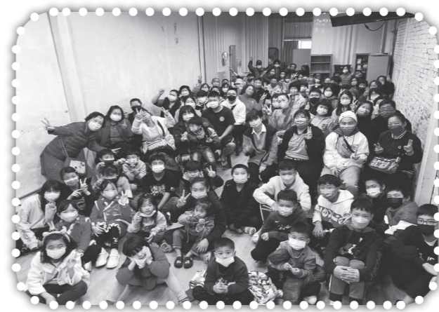
▲會友鄰居和家長大合照。