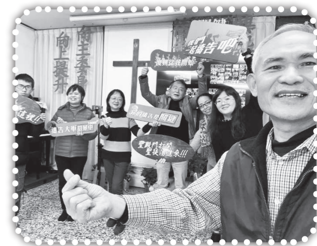
▲參與卓越北大行道會發起的關鍵100晨更禁食禱告會。