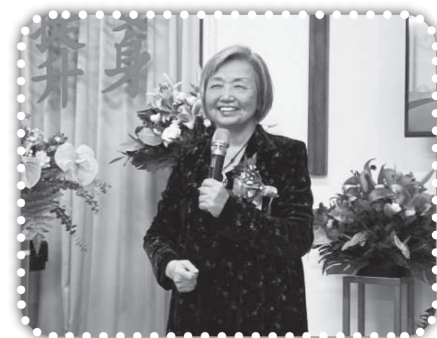
▲俞媽在感恩歡送會分享神的帶領及恩典。