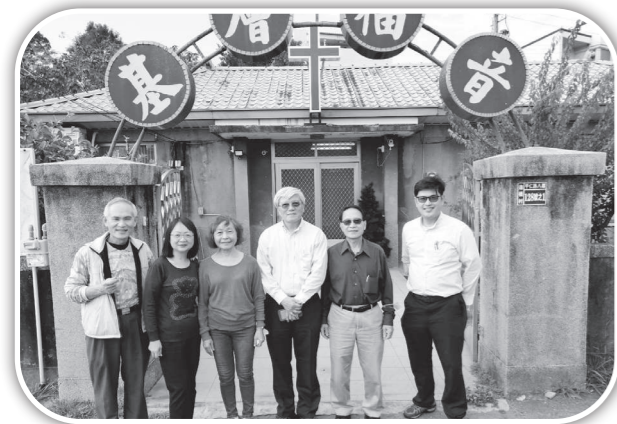
▲紐澤西主恩堂林長老及李弟兄夫婦拜訪基福。