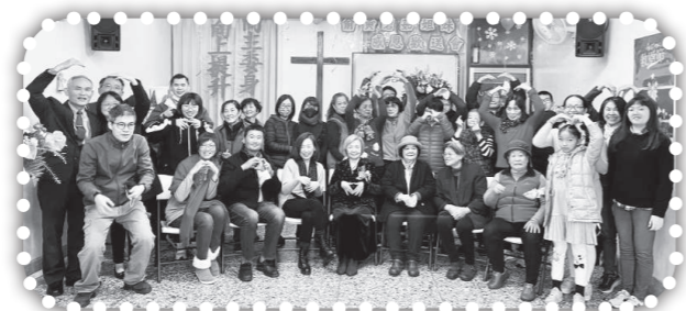
▲俞媽感恩歡送會合影。