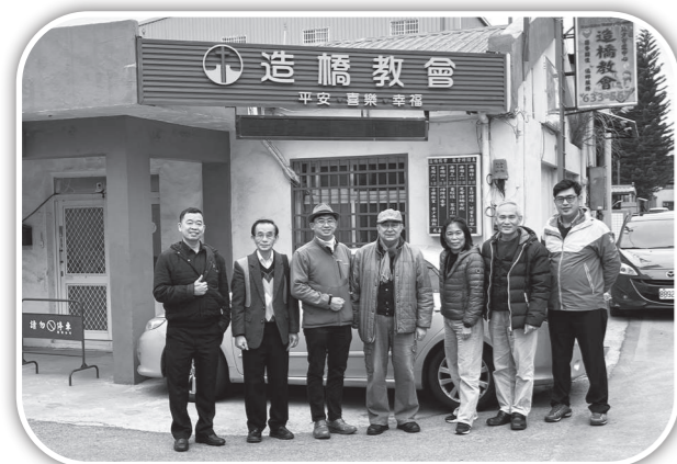
▲福音聯盟牧者拜訪造橋教會。