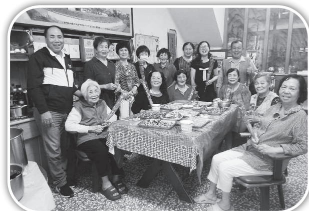
▲頭屋教會與鄰居慶祝母親節。