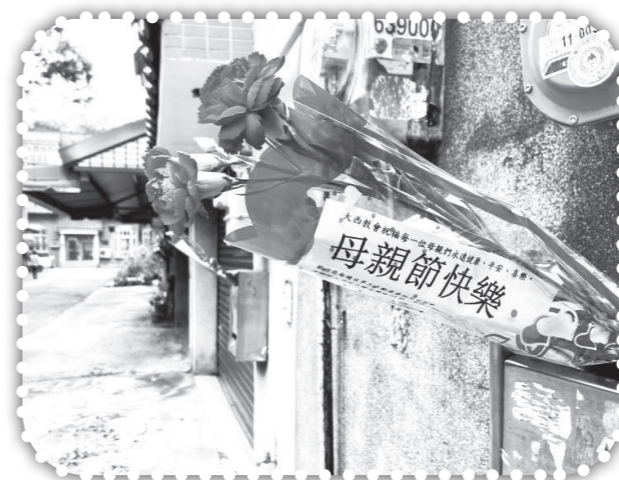
▲母親節祝福母親們-1。