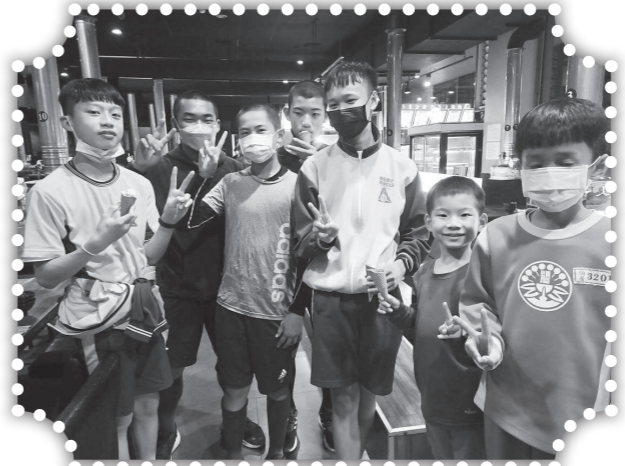
▲成績第一學生歡喜聚餐。