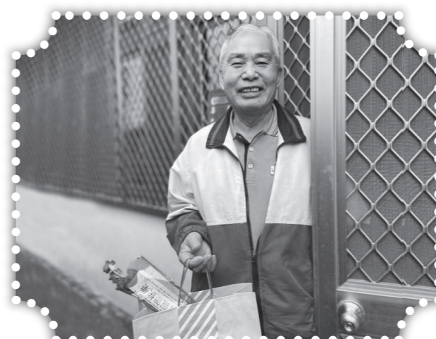
▲以母親節禮物祝福村裏的母親們。