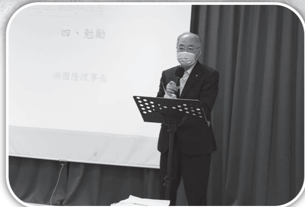
▲理事長在會員大會勉勵。