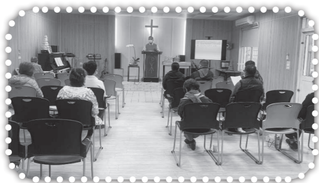
▲疫情中的主日崇拜。