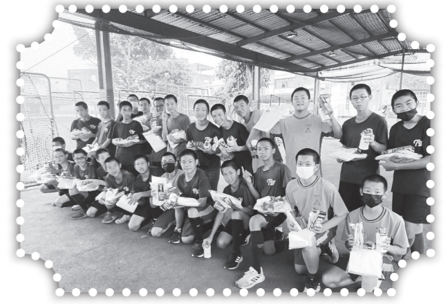
▲棒球隊的孩子領禮物。