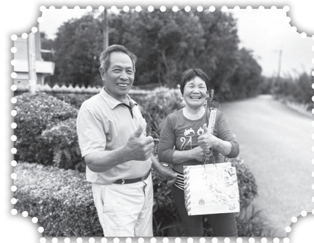
▲母親節祝福母親們-2。