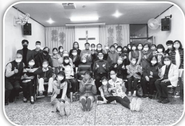
▲北門聖教會青橄欖牧區與大西弟兄姐妹合影。