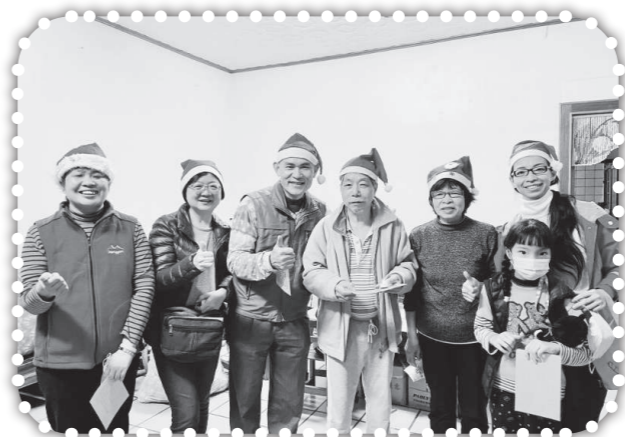
▲第一次到黃開本弟兄家報佳音。