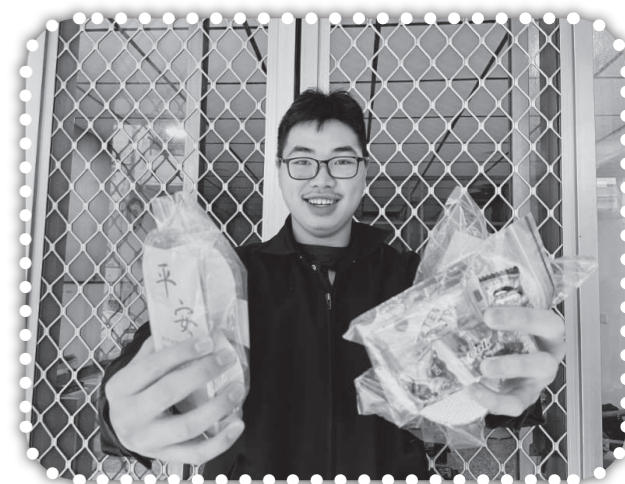
▲以聖誕糕及祝福包祝福村民。