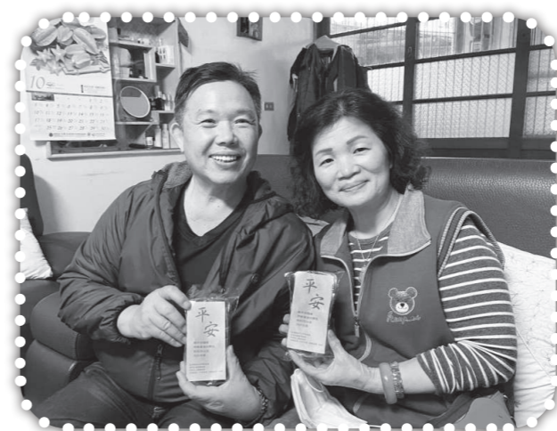
▲北門聖教會贈予聖誕糕讓我們送給村民。