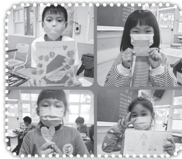
▲多才多藝的孩子們。