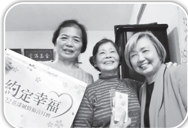
▲俞媽以相片年曆和聖誕糕祝福里民。