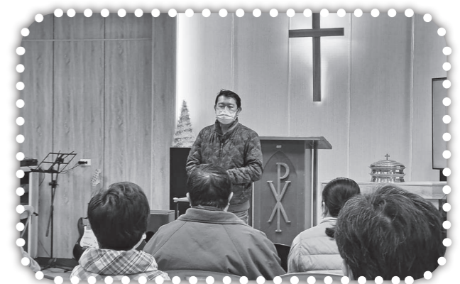
▲錫榮弟兄見證癌症得醫治。