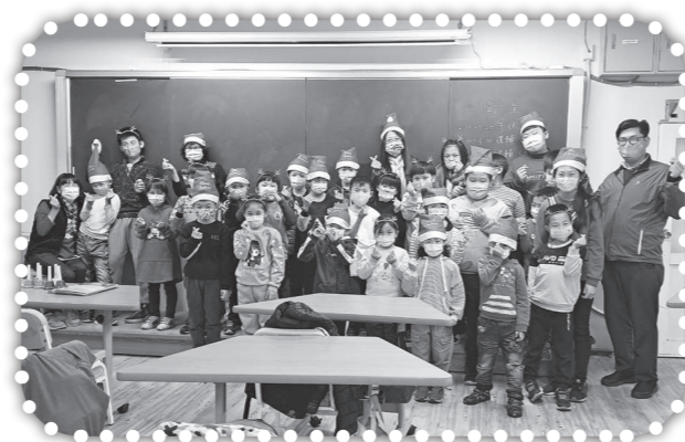
▲課輔班結業式校長、主任參與。