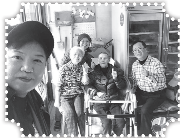
▲范牧師夫妻帶領左伯伯夫妻受洗。