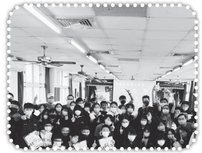
▲文英國中財商營合照。