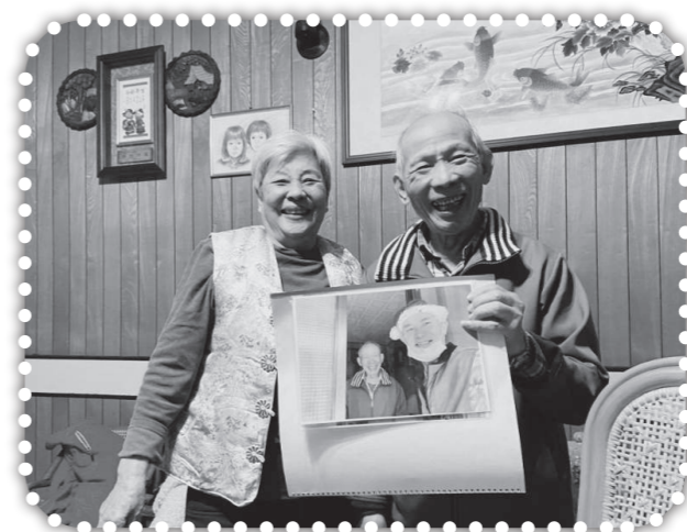
▲以相片年曆祝福村民。