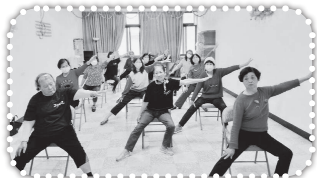
▲俞媽以拉筋操服事里民並傳福音。