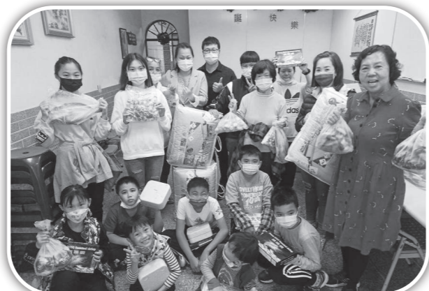
▲餐飲協會送食物給孩子。