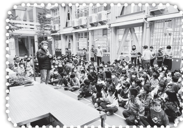
▲與錦水國小小朋友在聖誕節前歡聚。