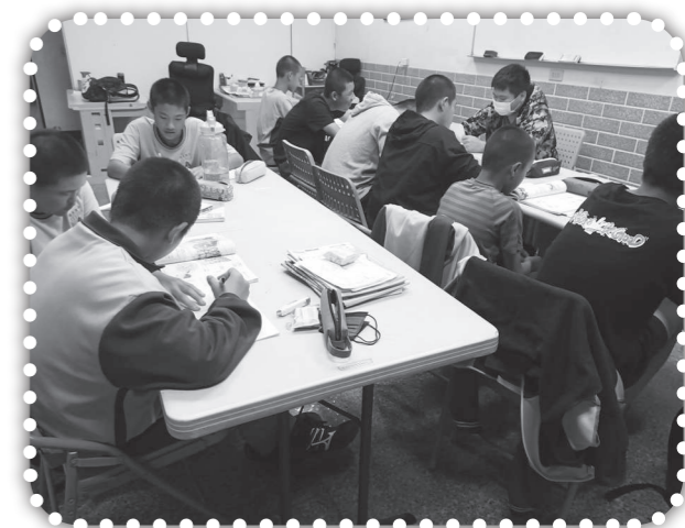
▲認真讀書的國中生。