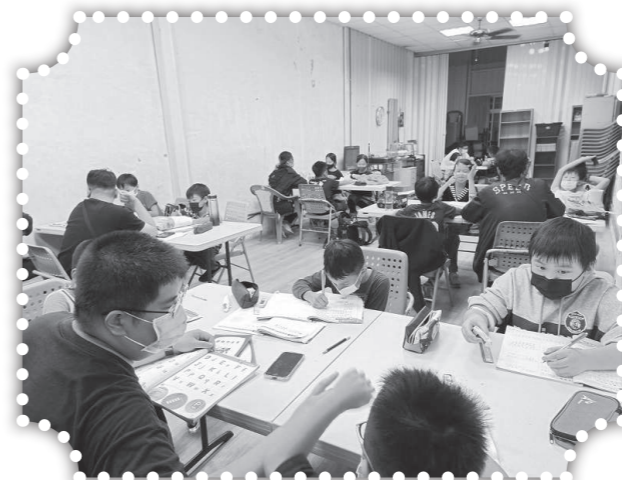
▲認真讀書的小學生。