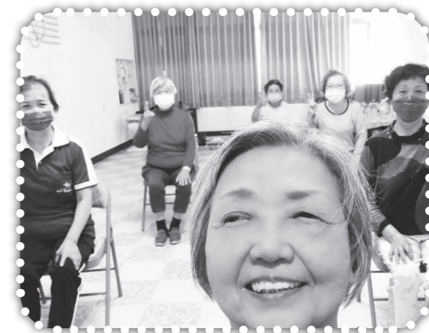
▲俞媽持續以拉筋操服事里民朋友們。