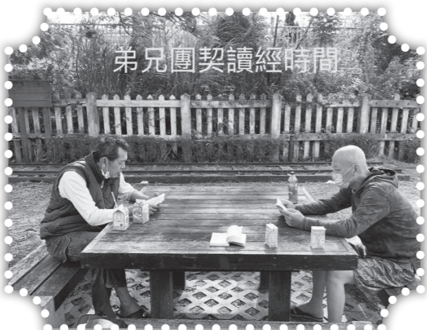
弟兄團契讀經時間