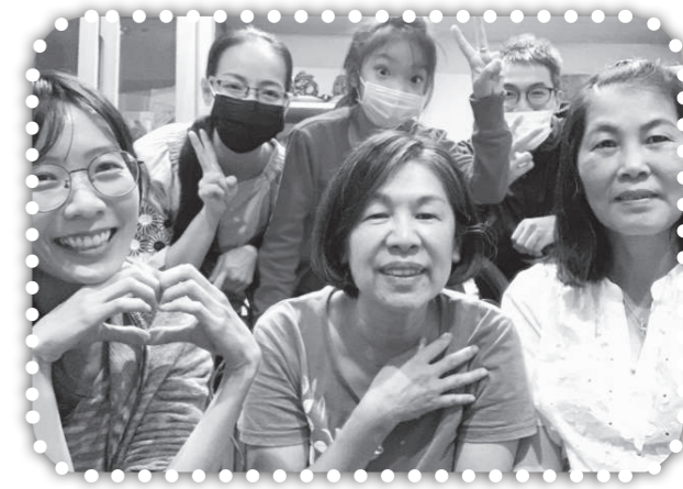
▲愛家小組疫情過後持續聚會並且越來越熱鬧了。