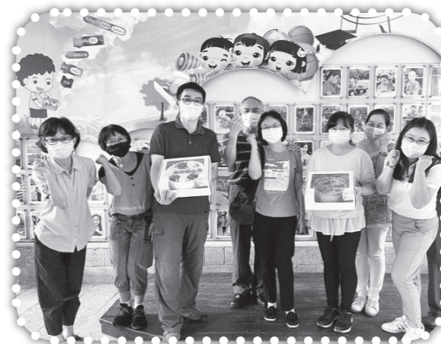
▲送蛋糕給鄉裏的四所國中國小的校長老師們祝福他們教師節愉快。