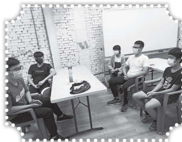
▲青少年學習分享心得。