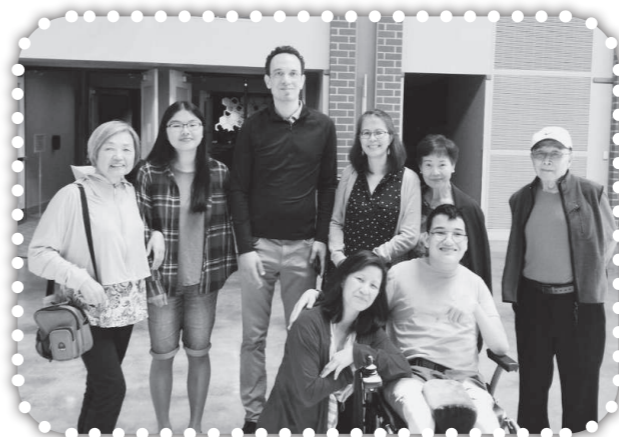
▲俞媽在美國與家人並弟兄姐妹們歡聚-2。