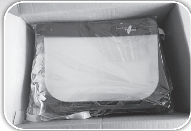
▲快樂協會贈送防疫面罩給孩子。