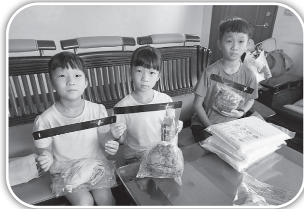
▲送面罩和麵包給孩子。