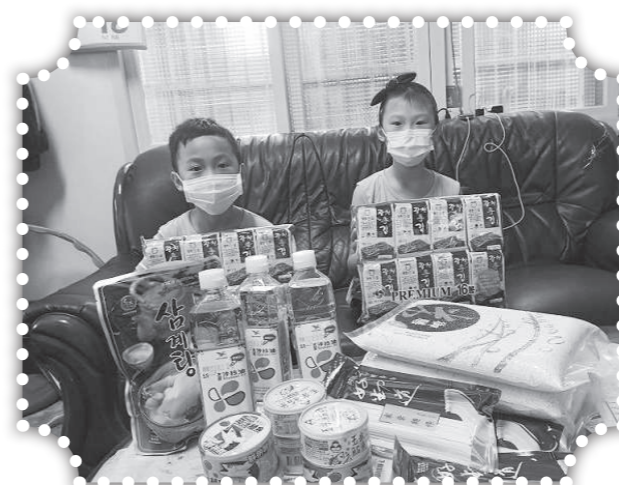
▲探訪游姓孩童及家人。