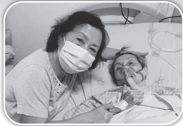
▲田牧師疫情期間探訪病人。