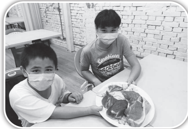
▲讓孩子帶一些肉回家。