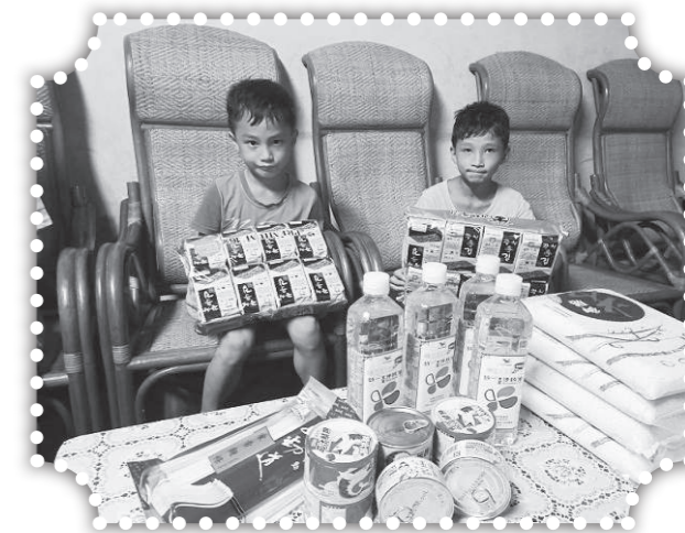
▲探訪彭姓孩童及家人。