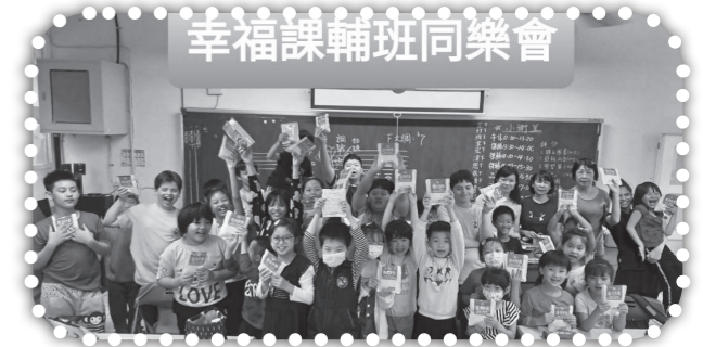
▲得勝者理財課程。（疫情前拍攝）