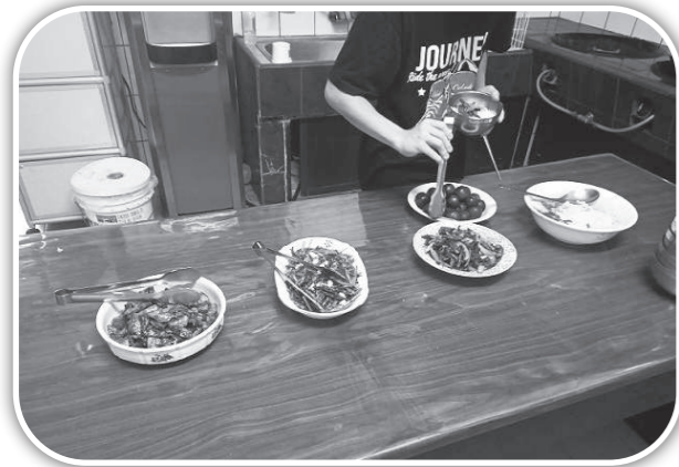
▲為「基要真理」學生預備午餐。