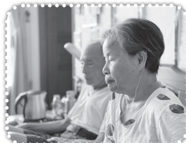
▲大曾爸爸大曾媽一起在線上參加主日聚會。