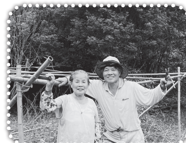
▲回台探望父母的森泉弟兄（右）。