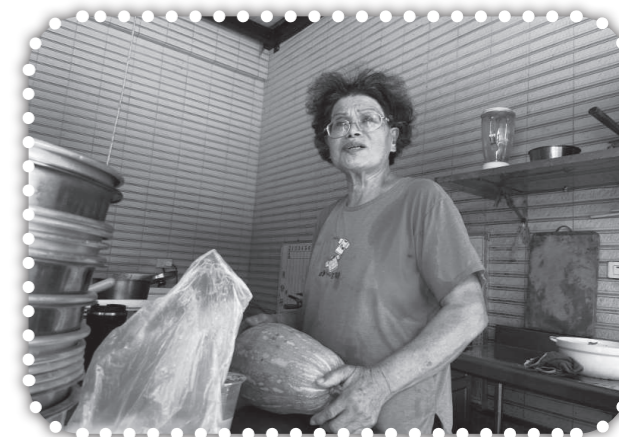
▲黃羅松妹媽媽很會關心肢體。