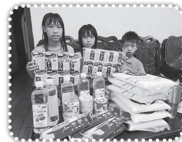
▲探訪徐姓孩童及家人。