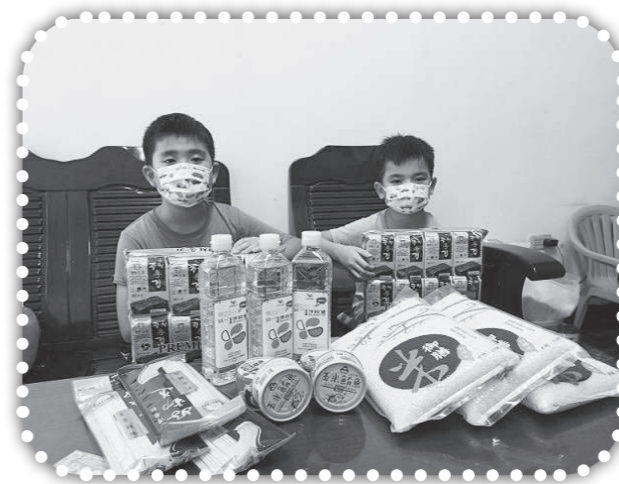
▲探訪徐姓孩童兄弟及家庭。