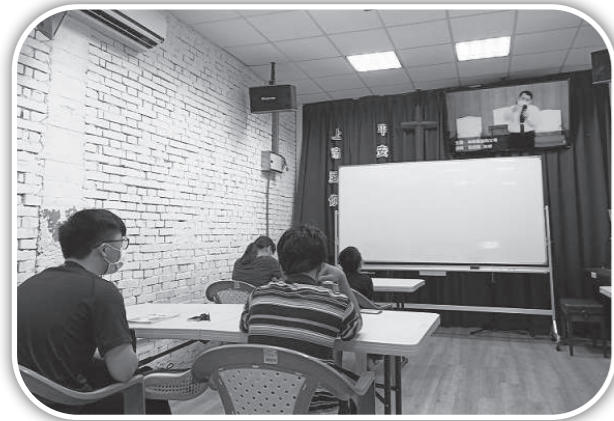
▲頭屋教會主日線上聚會及基要真理上課。