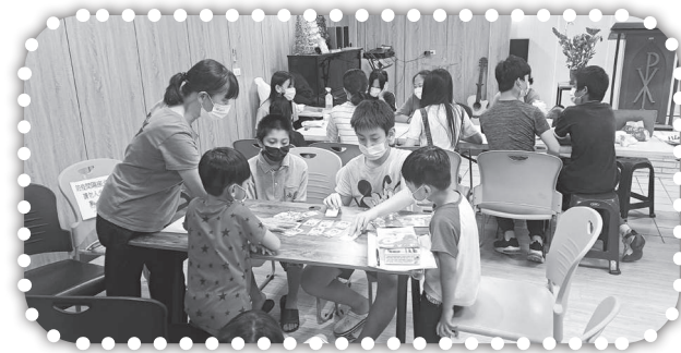
▲兒童桌遊品格課程。