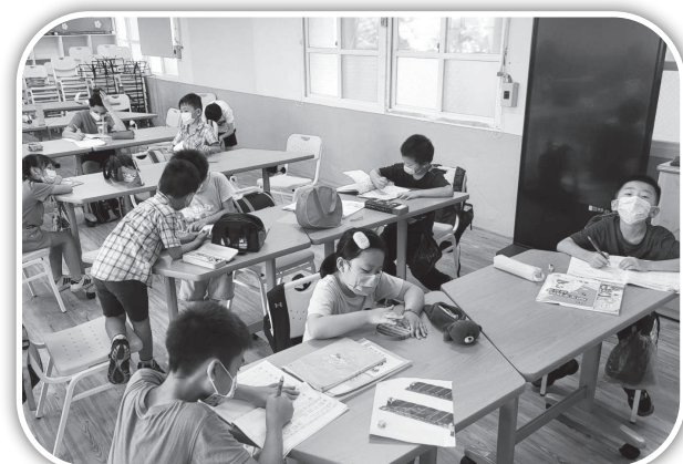
▲造橋教會課照班小朋友。