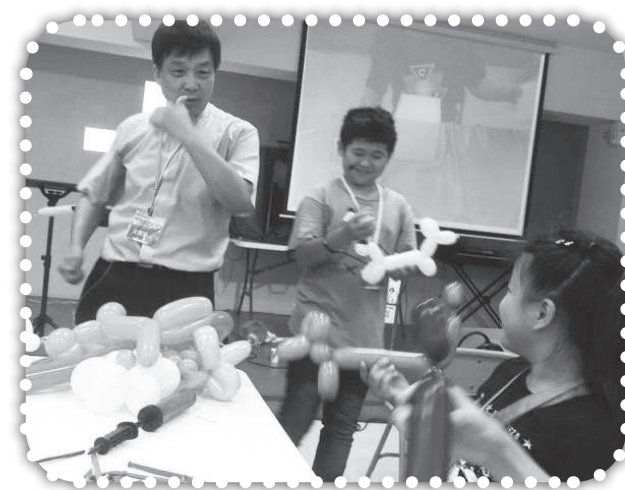
▲去其他教會參加兒童團契。