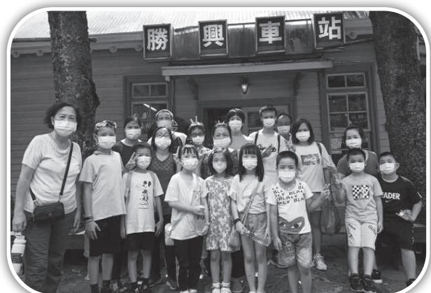
▲頭屋教會親子遊勝興車站。