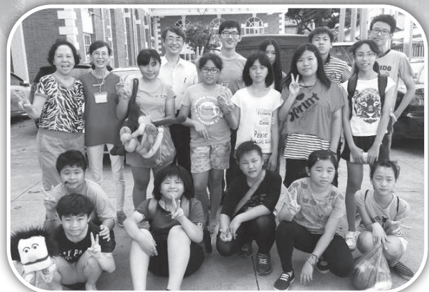
▲田牧師帶會友拜訪新竹浸信會。