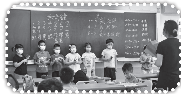
▲本學期才藝手搖鐘。