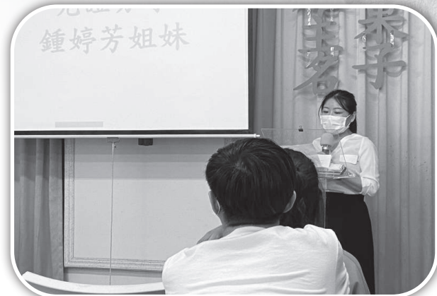
▲北門聖教會青橄欖牧區同工大西教會見證。