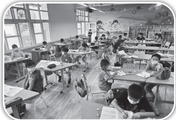
▲造橋教會的小衛星課照班。