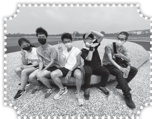
▲青少年出外半日遊。