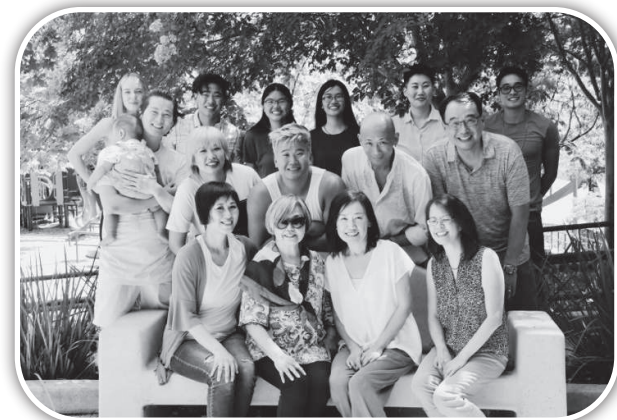
▲俞媽媽與美國的家人。