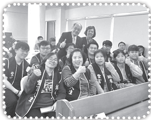
▲與理事長參加壯園靈糧堂（前壯園福音中心）獻堂。