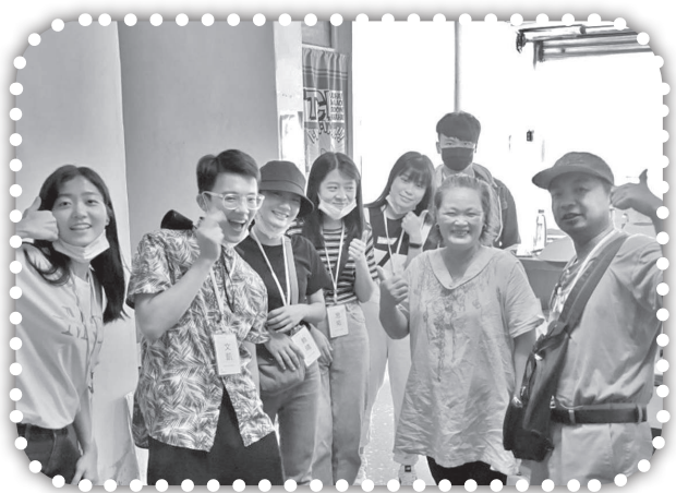
▲短宣隊探訪賴老師。