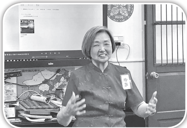
▲俞媽於幸福小組分享生命見證。