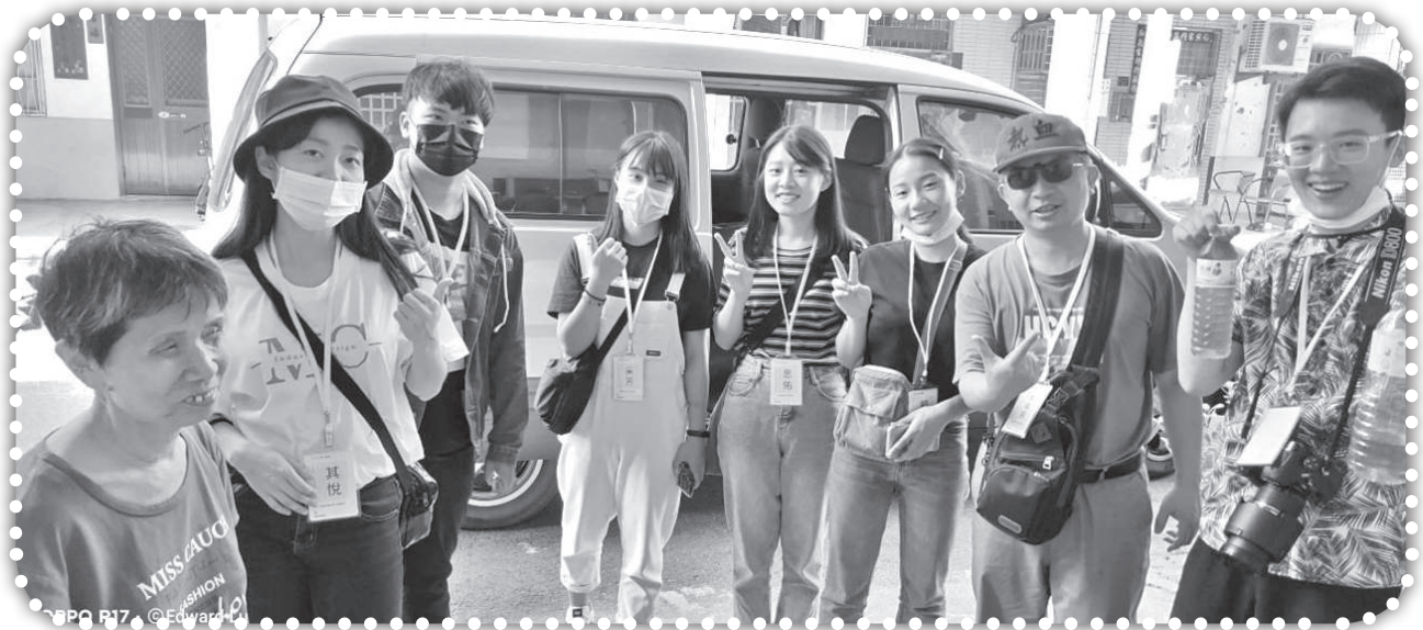
▲明志科大造橋短宣。