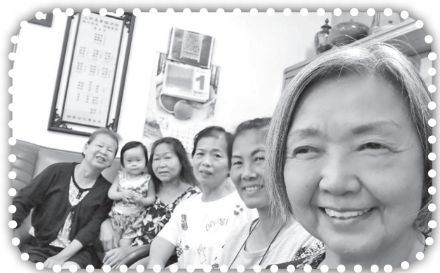
▲俞媽協助教會建立幸福小組事工。