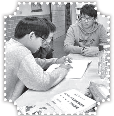
▲安親班數學分組時間。