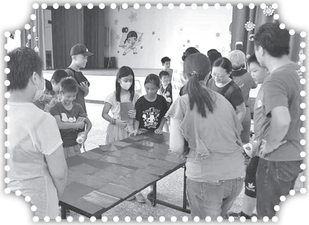
▲校園反毒親子協力。