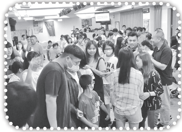
▲苗栗青年復興大會。