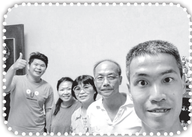
▲青因新冠肺炎暫停聚會的喜樂小組恢復聚會。