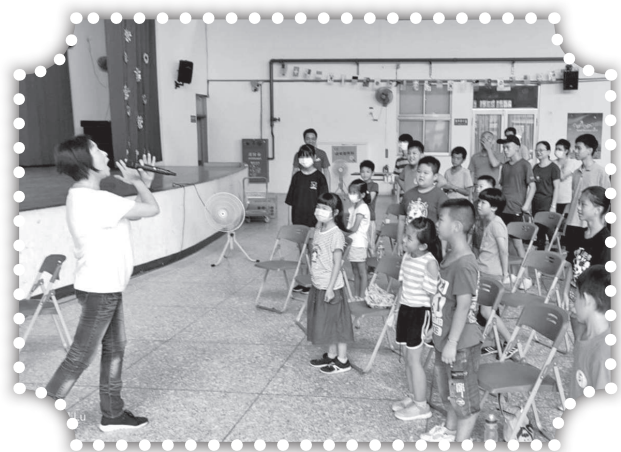
▲校園反毒詩歌帶動唱。