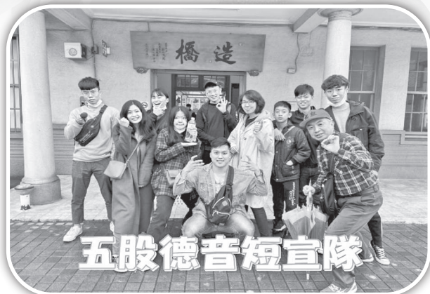
▲五股德音教會短宣隊在造橋。