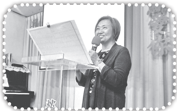
▲俞媽於主日見證主恩。