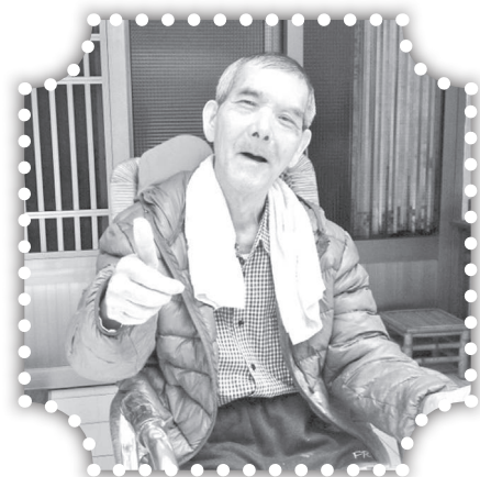
▲俞媽嗎關心的尖下里賴來發弟兄。