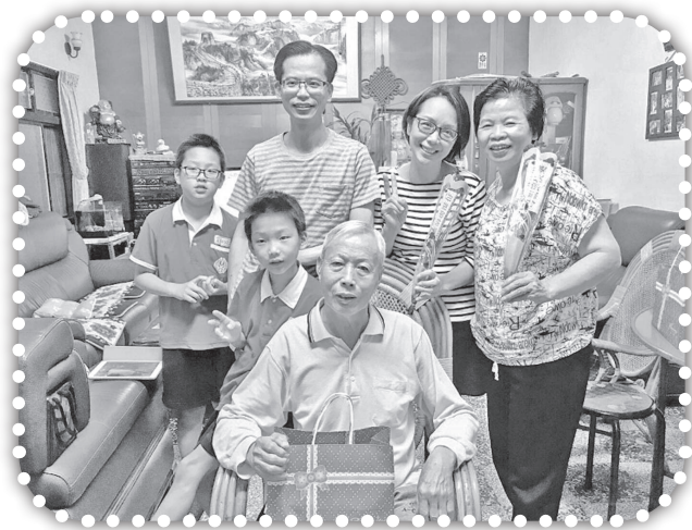
▲母親節以蛋糕及康乃馨祝福村民。

這就是一個母親的心，不論孩子如何，她就是不願意放棄，總想看到孩子有改變的一天。願天下的母親們都能來認識這位愛我們的天父上帝，相信當她們有了天父上帝的愛就可以有更豐盛的生命、家庭及婚姻，祝福全天下的母親們都能有幸福美好的一生。