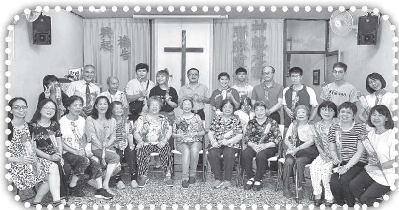
▲母親節合照，前排都是偉大的母親。