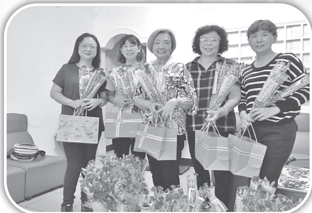
▲俞媽及同工們正準備要發送母親節禮物祝福里民。