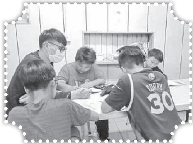
▲國小五年級數學指導。