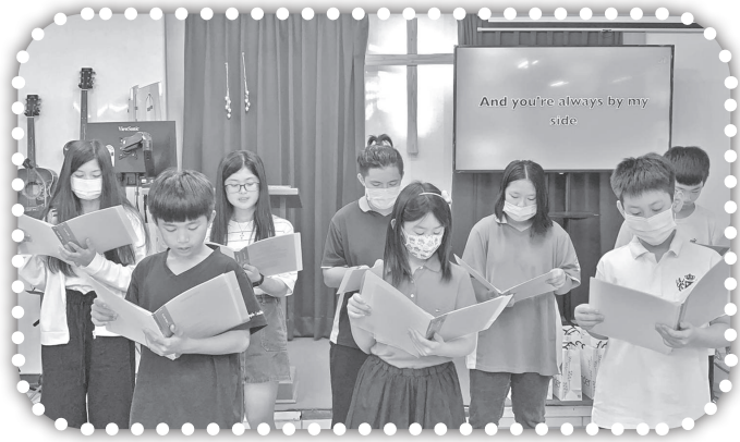
▲兒少主日獻唱英文詩歌。