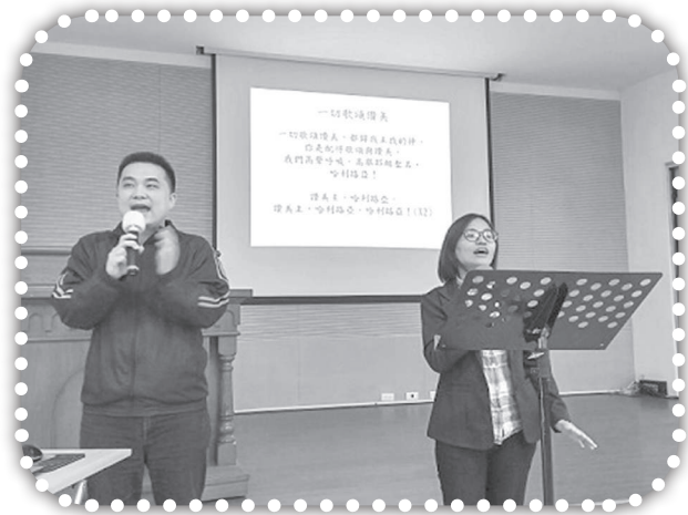
▲基福會員大會光慶茹敏帶敬拜。