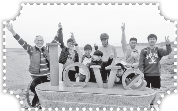
▲青少年到南寮漁港半日遊。