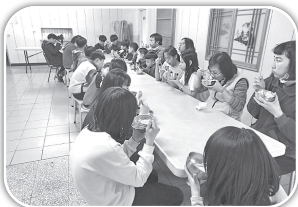
▲頭屋國小課輔班的晚餐。