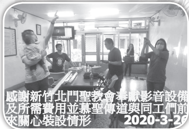
▲大西教會更新影音設備。