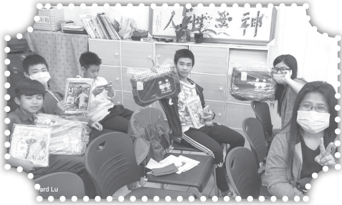
▲感謝愛心天使送來物資。