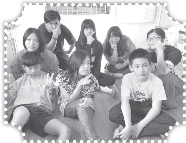
▲造橋教會青年領袖。