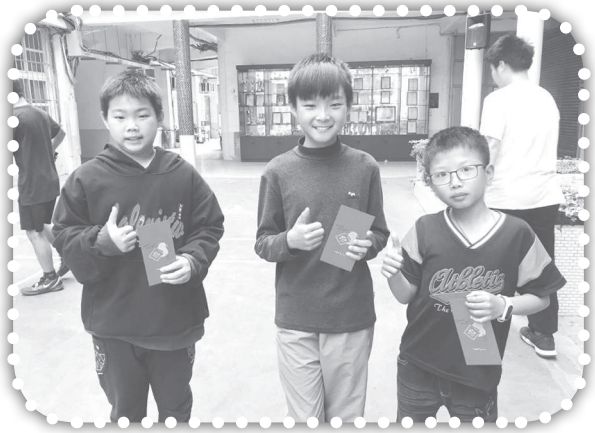
▲週六國小羽球比賽得獎者。