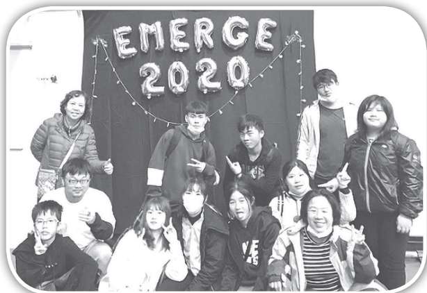
▲頭屋青年參加重燃特會。