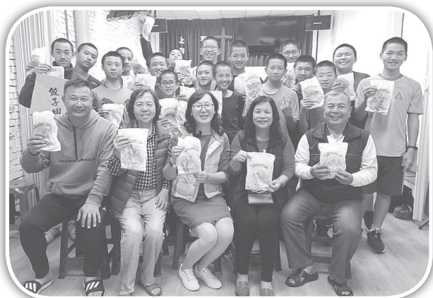
▲頭屋鄉長夫人村長夫婦拜訪頭屋教會。