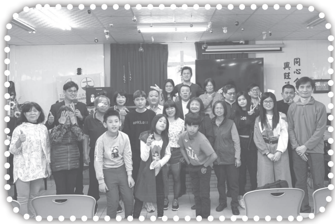
▲燕鵬牧師證道培訓。