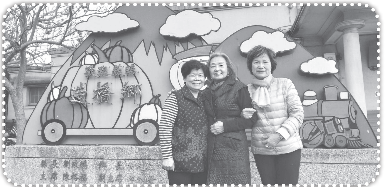
▲秀治師母與同工來關心俞媽及大西教會。