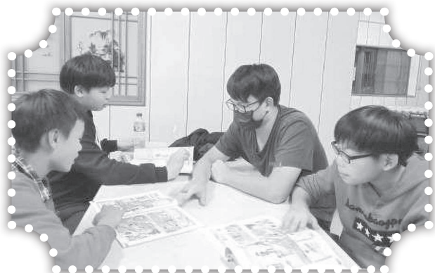
▲國小6年級英文輔導。

為期四天三夜，在台北商業大學的「重燃特會」，為我信主多年的生命，烙下一個全然不同的印象，主太棒了！