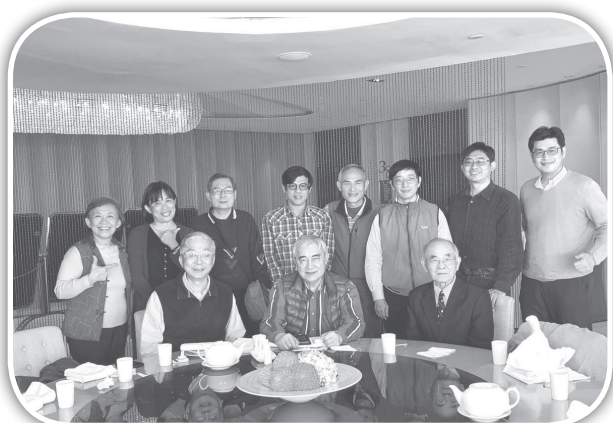
▲福音聯盟牧者台南聚集。