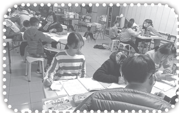
▲課輔班的小學生上課。