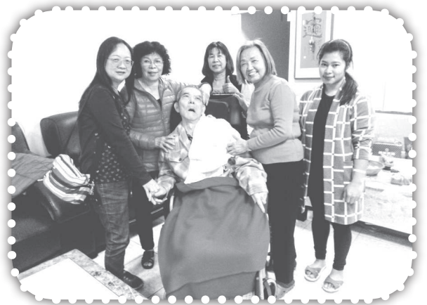
▲與俞媽同去關心鄰居。