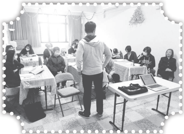
▲感謝漁歌老師到俞媽家舉辦門徒訓練。