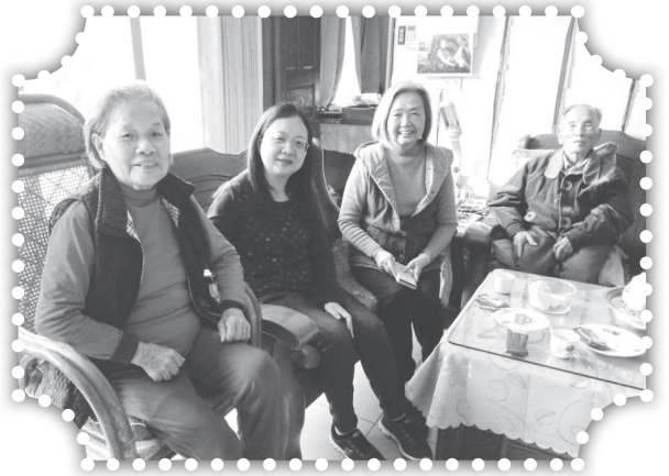
▲俞媽與李師母再去關心大曾媽媽及大曾爸爸。