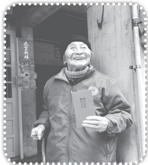
▲97歲的黃媽媽開心收到一元紅包。