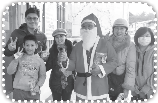
▲聖誕節同工一起服事。