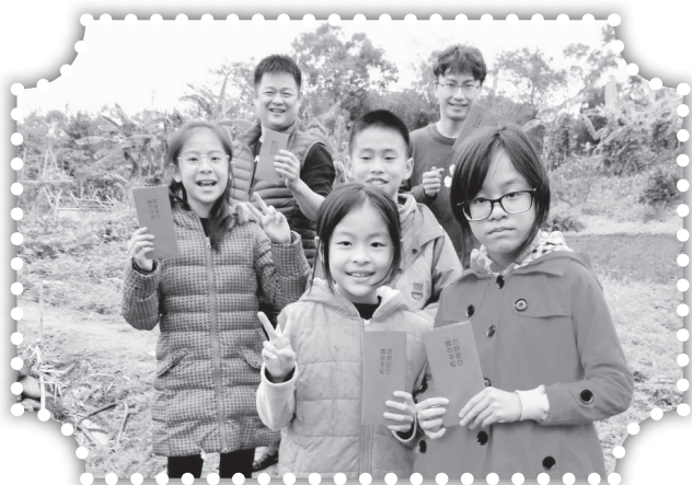
▲發送一元紅包祝福村民-2。