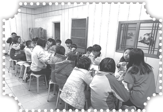
▲課輔班孩子吃晚餐。