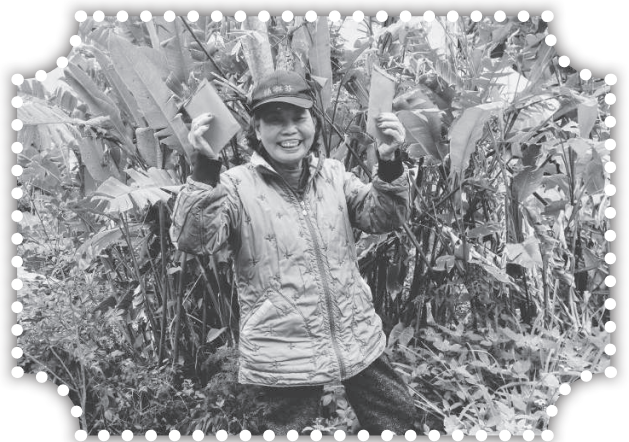
▲發送一元紅包祝福村民-1。