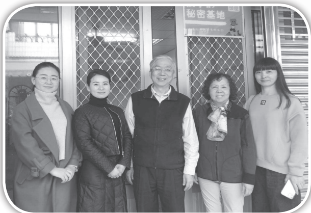
▲來自福建的肢體拜訪頭屋教會。