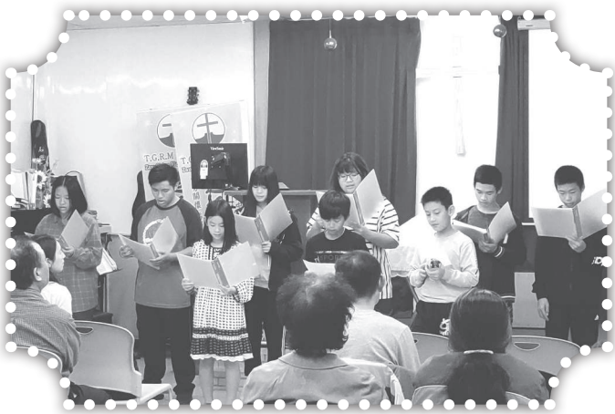
▲兒童與青少年英文獻詩。