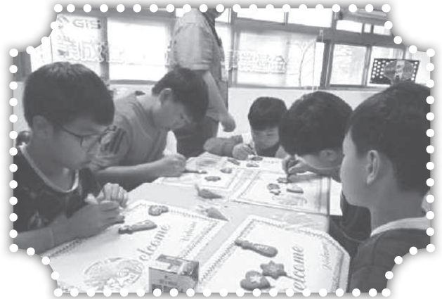
▲國小課輔班前往頭份烘培坊製作糖霜餅乾。