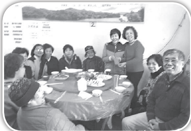
▲建華弟兄關心頭屋教會的長者。