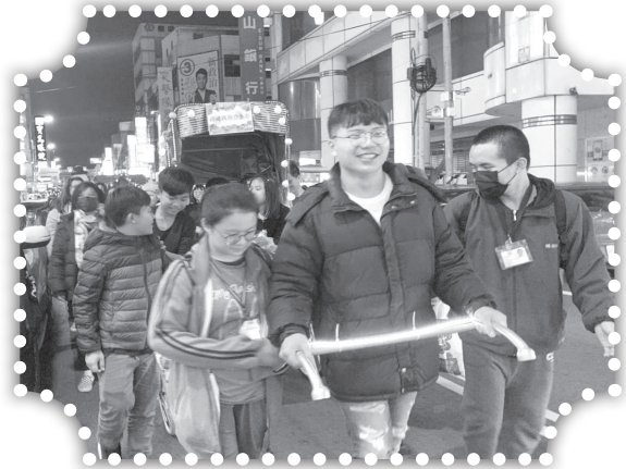
▲聖誕節在竹南踩街遊行。