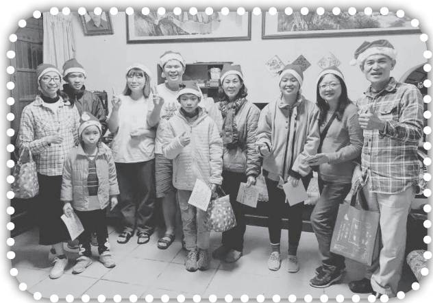
▲-到弟兄姐妹及慕道朋友家報佳音。