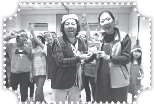
▲往協和醫院養老院報佳音致贈養老院祝福紅包。