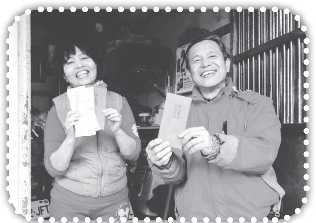
▲發送一元紅包祝福村民-3。