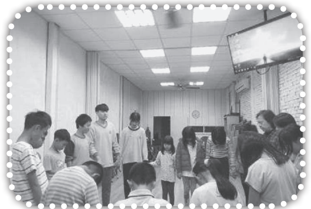
▲兒童主日學牽手結束禱告。