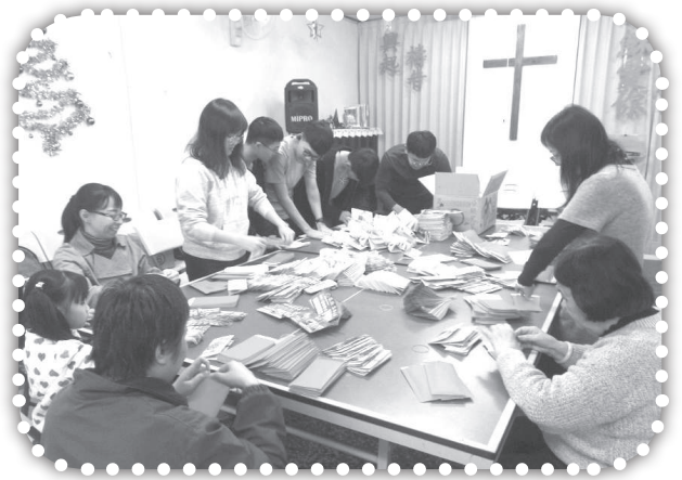
▲弟兄姐妹們一起預備過年要向村民發送的紅包。