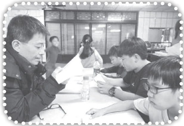
▲國小課輔班讀聖經。

或新車，可以在明德社區發揮功用，接送有需要的長者，出來到苗栗就醫，並傳揚福音，領人歸主代禱！