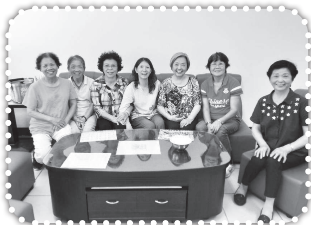
▲參加俞媽「拉筋操」的鄰居朋友。