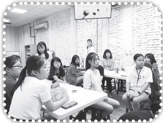
▲時裝彩妝體驗活動仔細聽彩妝示範。