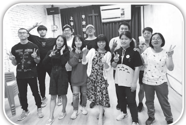
▲頭屋青少年與新竹浸信會團隊合影。