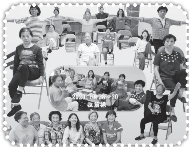
▲俞媽在尖下里以拉筋操來傳福音。

那時三姐說，這樣的移民都能辦出來，相信七弟家的孩子要被主用。感謝主讚美主！如今我們全家都事奉主！