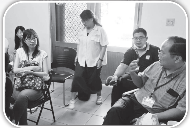
▲信義神學院師生前來關心造橋教會。