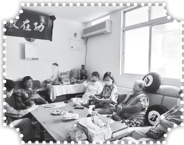
▲明德小組探訪黃伯伯黃媽媽。