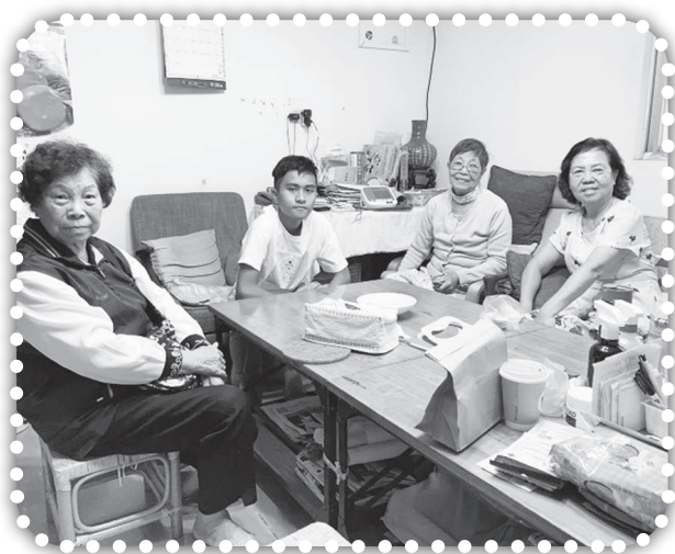
▲探訪黃媽媽和孫子煦承並領聖餐。