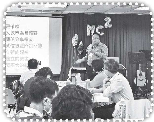
▲參加CCF倍增小組培訓。