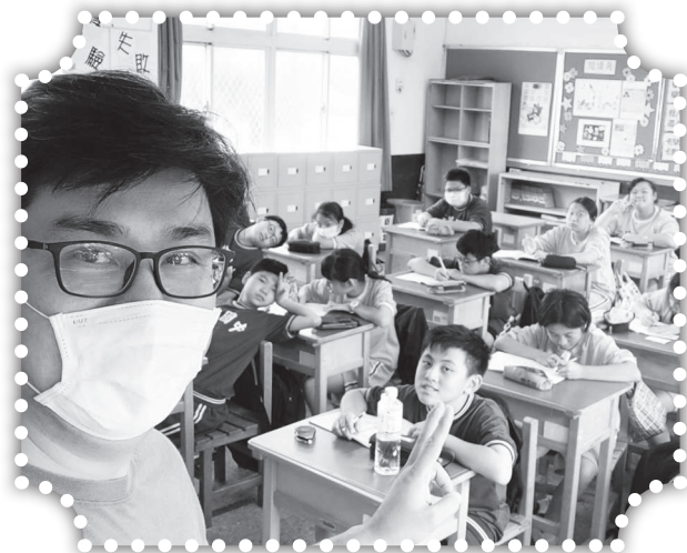
▲國中「得勝者」課程上課情形。