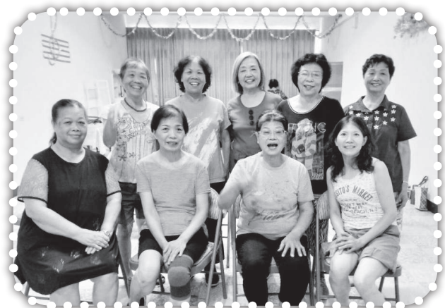
▲俞媽在尖下里服事里民。