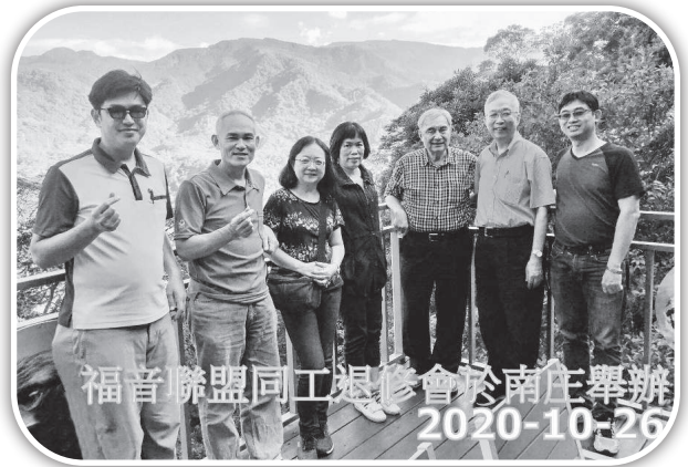
▲福音聯盟同工退修會於南庄舉辦。