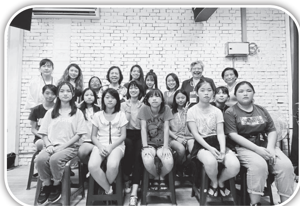
▲頭屋「you are beautiful」活動大合照。