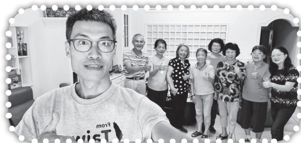
▲第四期幸福小組聚會。