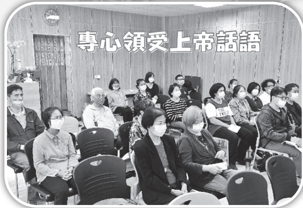
▲在造橋新會堂專心聚會。