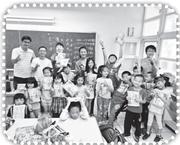
▲芥菜種會關心學生。