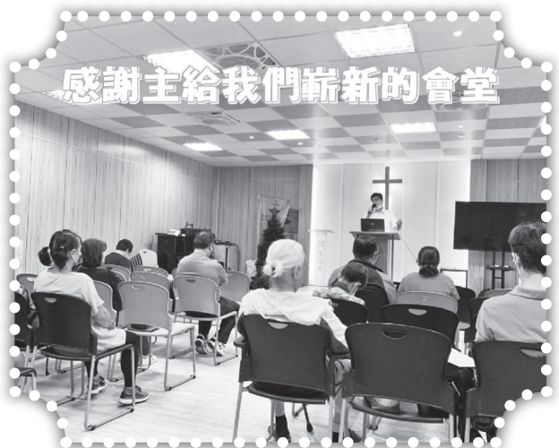
▲浴火重生的新會堂。