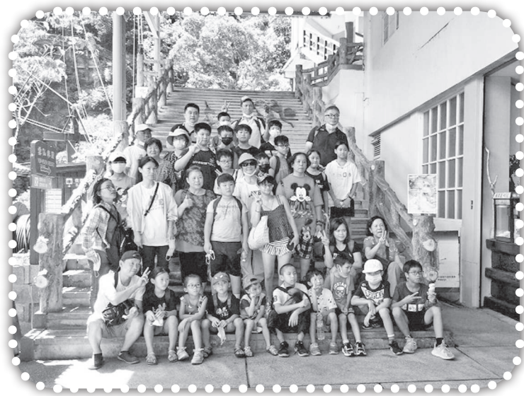
▲暑假遊烏來雲仙樂園。