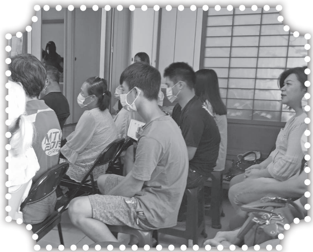
▲主日暫時到辦公室聚會。