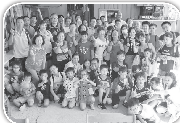
▲頭屋教會參訪亞杜蘭關懷協會。