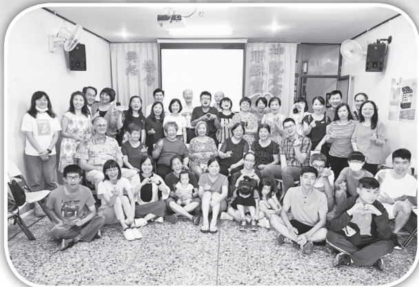
▲北門聖教會與大西弟兄姐妹們合影留念。