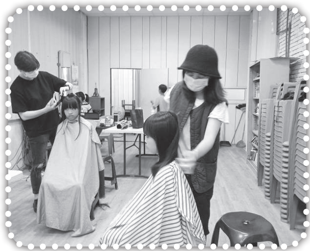
▲善耕設計師來教會義剪。