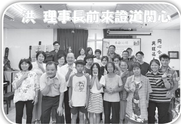
▲理事長在造橋教會服事。