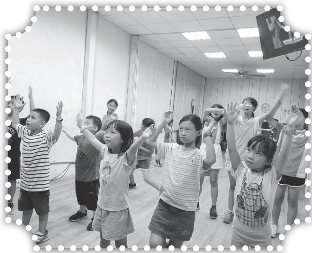
▲主日學唱詩跳舞讚美神。