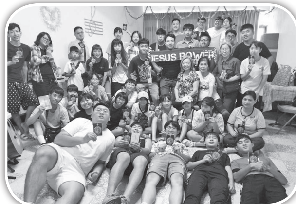
▲華岡團契再次到苗栗頭份市逐家佈道。