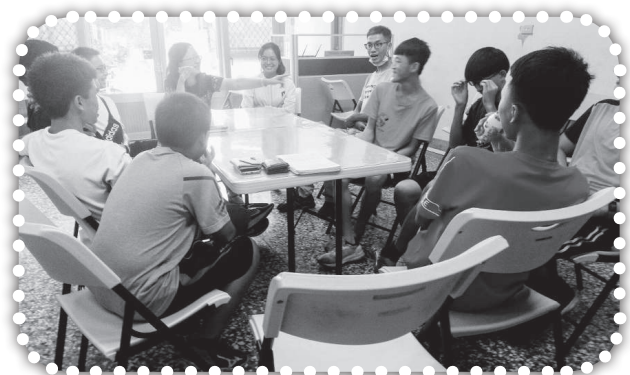
▲主日下午青橄欖聚會。