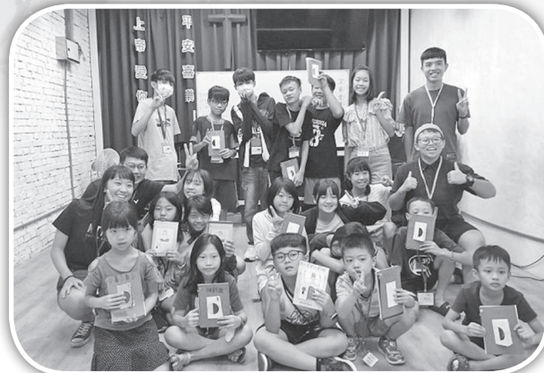
▲宜蘭靈糧堂暑期到頭屋短宣。