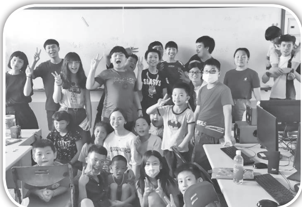
▲輔大與明志科大團契協助造橋課輔班。