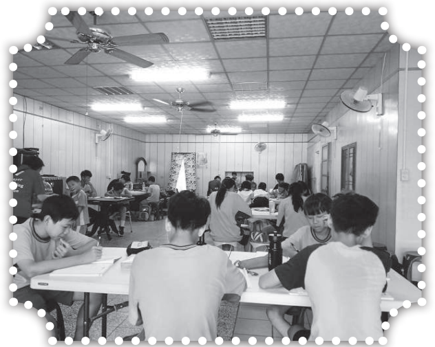
▲課輔班英數分組輔導。