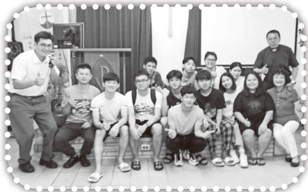
▲關心的越南僑生畢業了。

2. 請為8/6~11飛颺夢想暑期營、8/23~25福音聯盟靈修會等暑期營會禱告，一切順利蒙福。也請為教會的小組事工禱告，家庭幸福小組、青年領袖小組、社青壯年小組，求神使用每個小組，建造教會每個肢體。