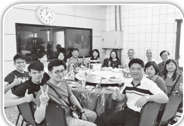
▲與大西國中校長主任聚餐。