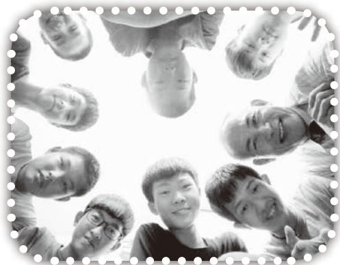
▲教會的青少年分組禱告後合影。