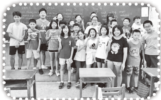
▲營會中學生們與大哥哥大姐姐開心合照。