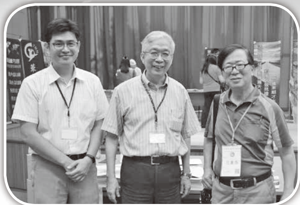
▲參加校園團契主辦的青宣博覽會。