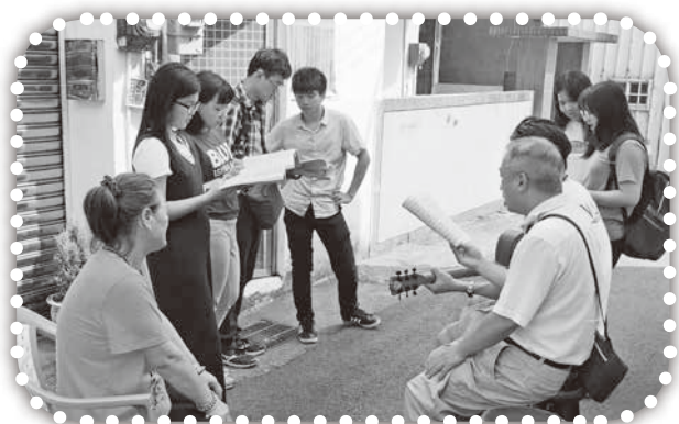
▲短宣隊探訪榮英媽媽。