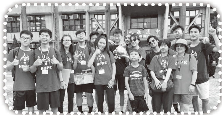
▲上海華商團契與聖地牙哥雅歌堂合組的短宣隊。