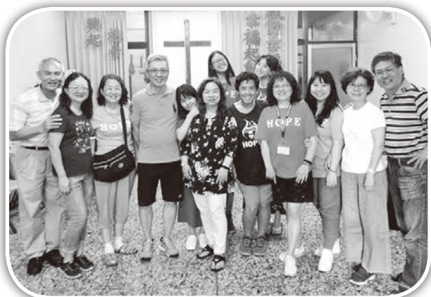
▲聖地牙哥雅歌堂及上海華商團契短宣隊在大西。