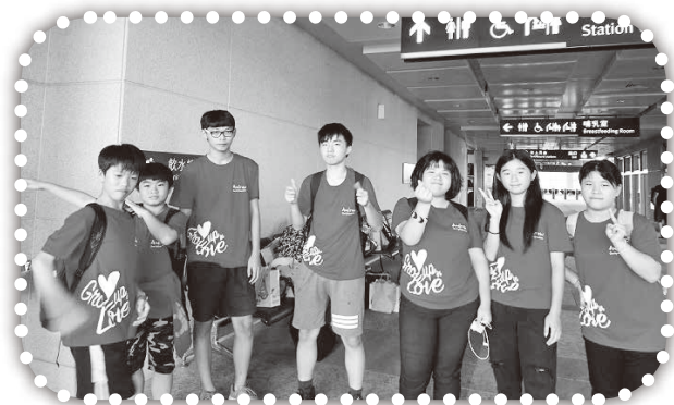
▲參加生命成長營的學生。