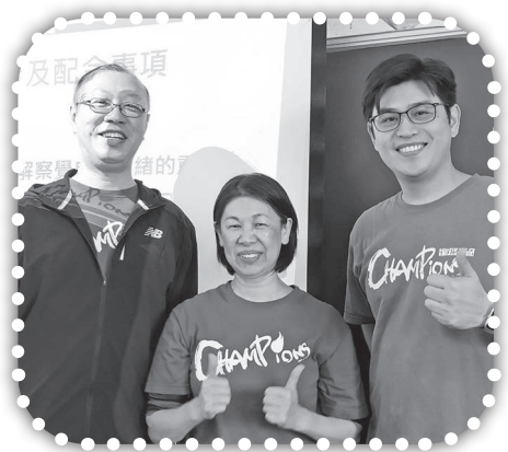
▲得勝老師同心服事。