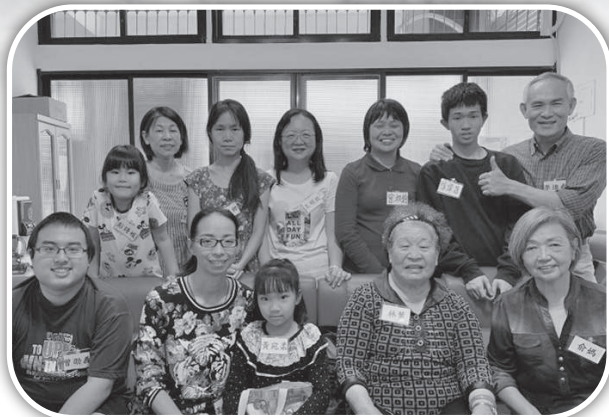
▲大西教會第一期幸福小組