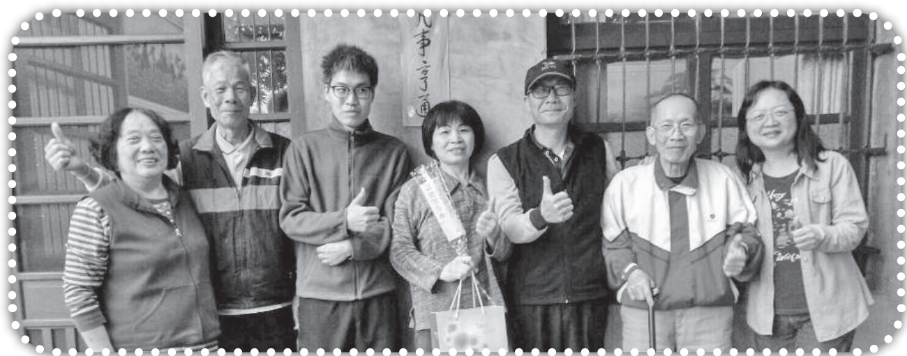
▲週六一早去向全村發送康乃馨花祝福村民。