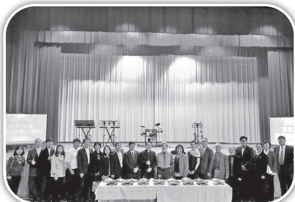
▲苗栗復活節聯合禮拜。