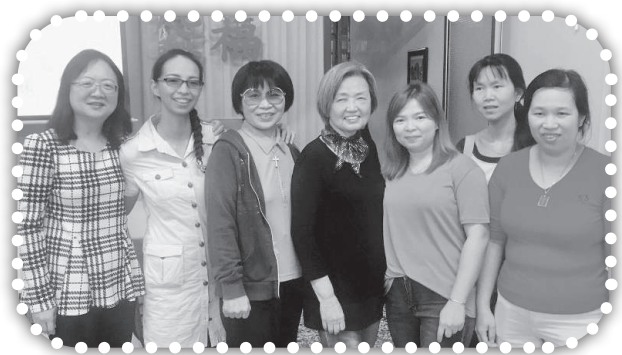
▲主發命令傳好信息的婦女成了大群。

3.請為7月1日到5日聖地牙哥雅歌堂及上海華商團契將再次合作到大西教會服事，在大西國中舉辦英文營會禱告，求神記念並賜福他們手中所作的工。