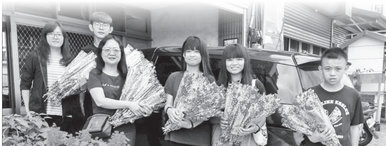
▲以康乃馨花及母親節蛋糕祝福村民及弟兄姐妹們。