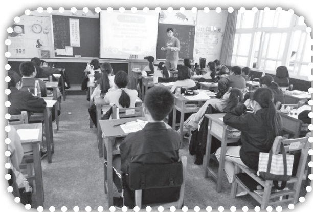
▲得勝課程上課情形。