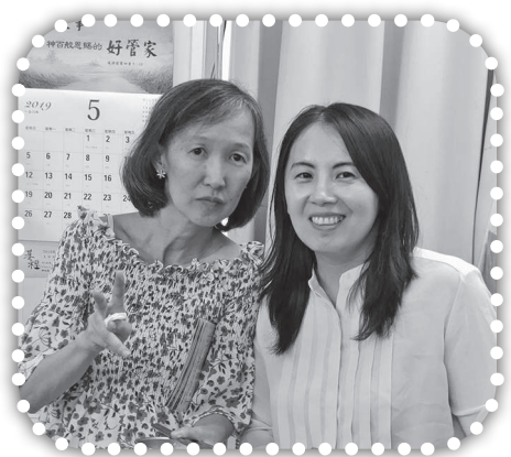
▲呂師母為姐妹祝福。

2. 請為教會的小組事工禱告，家庭幸福小組、青年領袖小組、社青壯年小組，求神賜福。