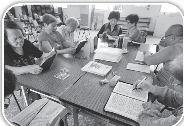
▲頭屋教會的明德小組。