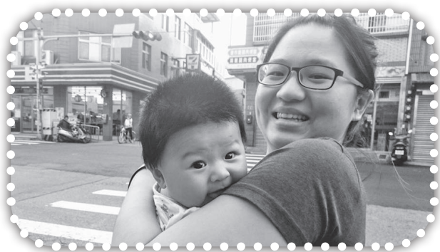
▲黃媽媽的孫女帶著可愛寶貝女兒。