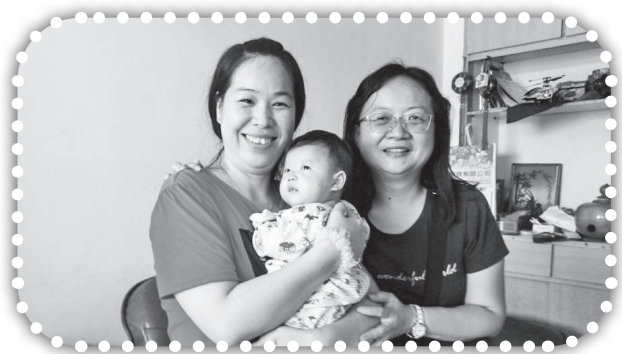
▲探望曾太太及剛出生才4個月的寶貝兒子。