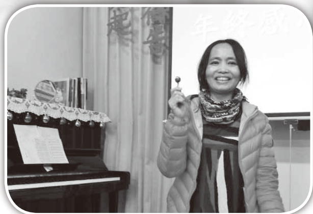
▲大西年終感恩見證肢體述說神恩。