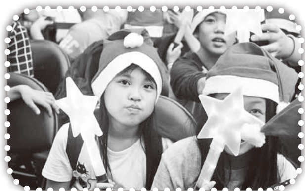
▲參加新光三越聖誕點燈。