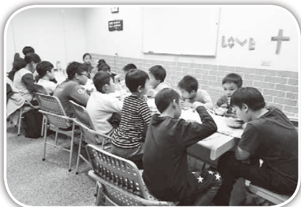
▲頭屋孩子一起吃晚餐。