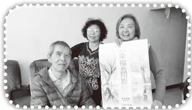
▲俞媽以相片月曆祝福里民。