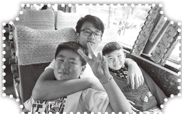
▲受邀上台北的遊覽車上。