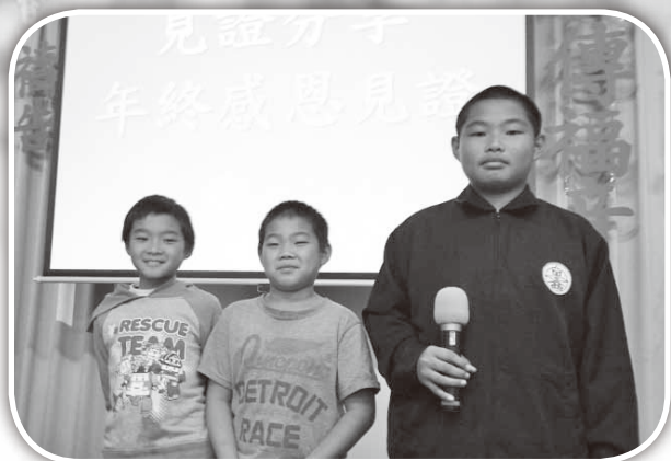
▲大西年終感恩見證徐家三兄弟上台感恩。