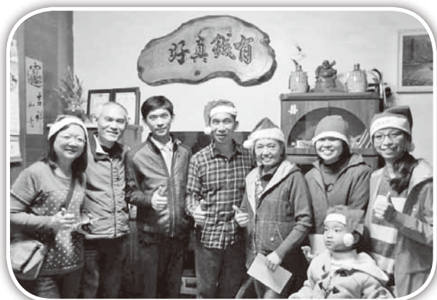
▲同工們與俞媽到尖下里慕道朋友家報佳音。