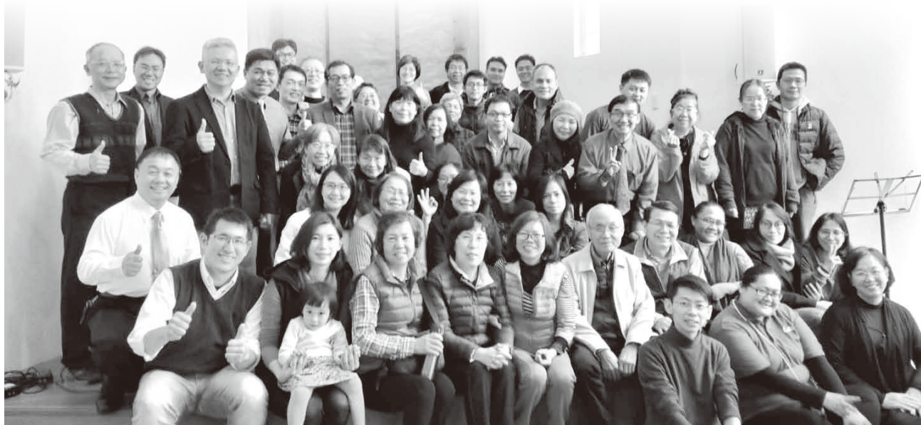
▲苗栗牧者齊心禱告。

最後要將感恩獻上為祭，新年是一個新生、也是一個悔改反省的日子。回想過去一年，許多對神對人的虧欠，今年要更多的補足，並堅心行在上帝的旨意中，不倚靠自己的勢力才能，乃要與神同行。新的一年先學亞伯拉罕築壇獻祭，讓神掌權在其中，也祝福各位新年蒙恩，福杯滿溢，一起來主面前，築壇獻祭吧！願神賜福您們的一切，阿們。