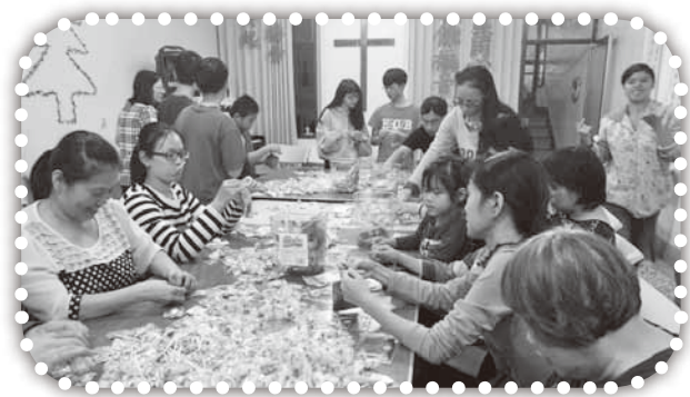
▲主日下午弟兄姐妹們同心完成聖誕節祝福包。