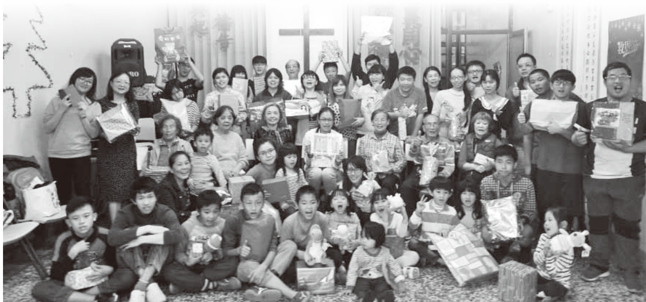
▲弟兄姐妹交換禮物彼此祝福。

許多的外籍新娘嫁到台灣之後，發現他們有適應上的困難，有夫家的問題，有生活習慣的不同，有語言上的溝通問題，有價值觀不同的問題，還有常常掛念著在家鄉的父母及親人，若要回去一趟並不容易，他們所遇見的難處真的不少。