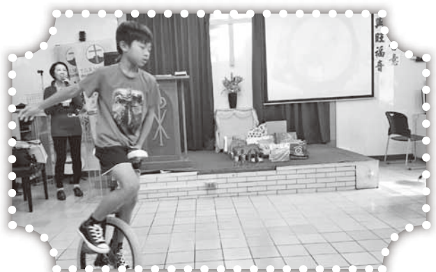
▲聖誕節獨輪車表演。