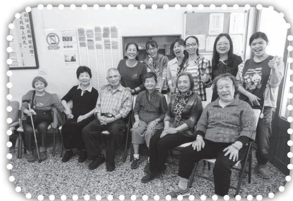
▲在耶穌裏我們是一家人。