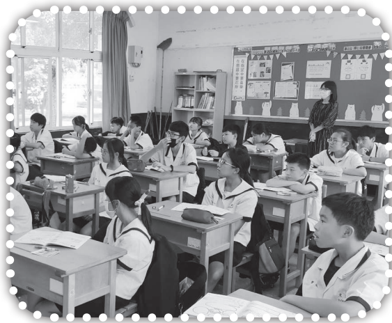
▲國中學生上得勝者課程。