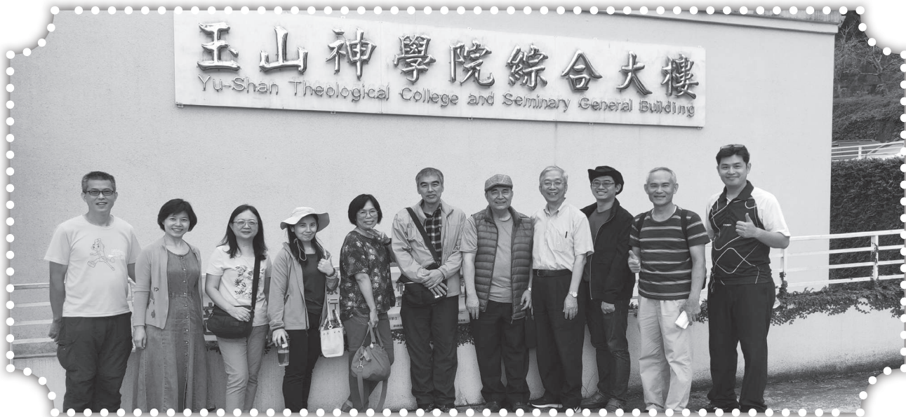
▲參加福音聯盟牧者退修會。