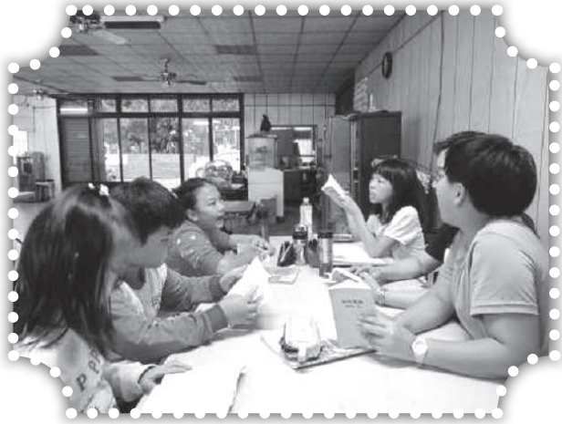
▲國小學生分組讀經。