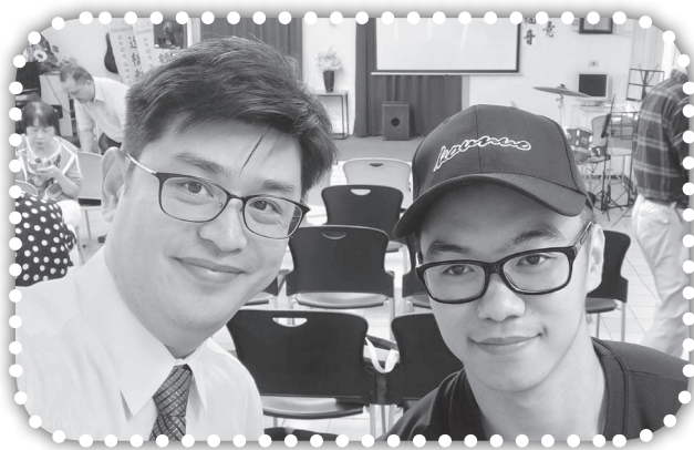
▲關心當兵的鄰居維安弟兄。