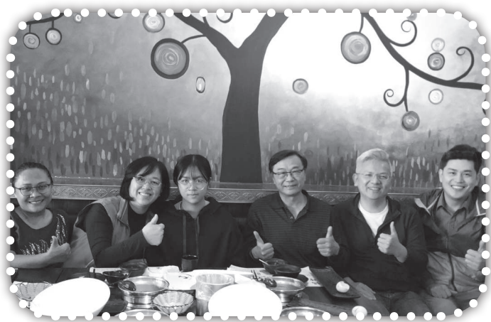
▲苗栗牧者討論聖誕聯合事工。