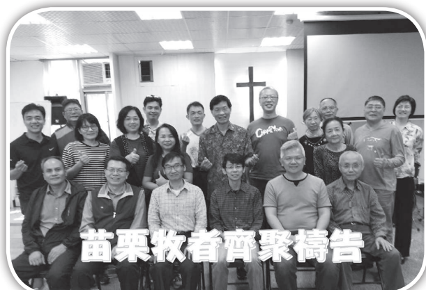
▲造橋牧者與苗栗牧者一起禱告。