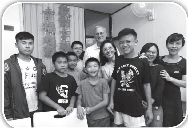
▲北門聖教會同工與大西青少年。