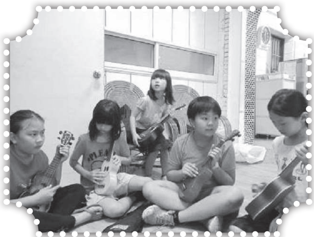
▲小朋友彈奏烏克麗麗。