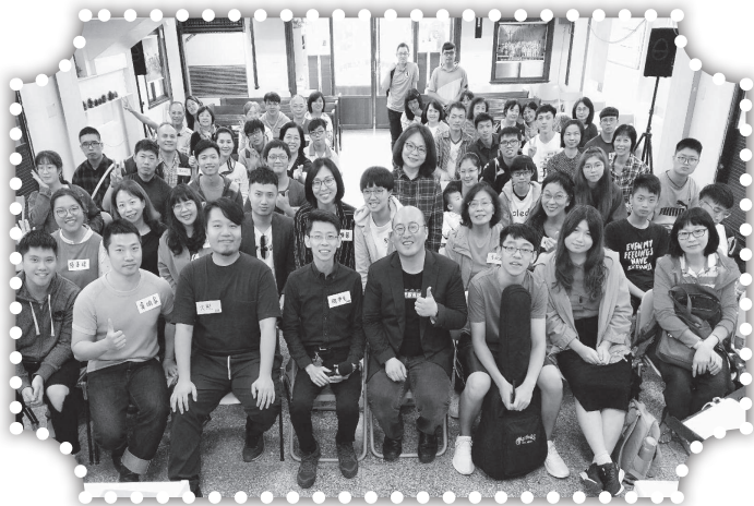
▲參加讚美之泉培訓。