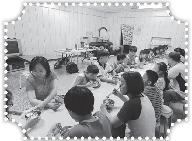
▲課輔班孩子吃晚餐。