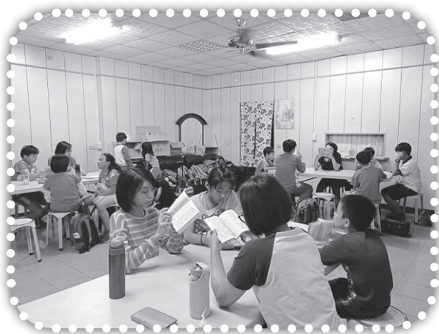
▲小學生在新租的場地讀書。