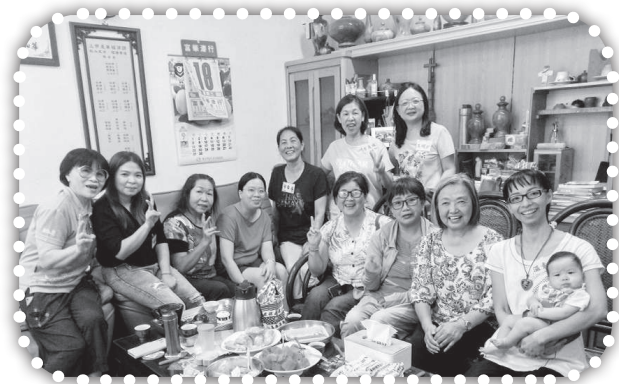
▲第二期幸福小組第一次聚會與best合影留念。

未來我們會繼續向著神給我們的異象一大西村成為基督村一努力前進，請您繼續支持大西教會的事工，為我們守望代禱。