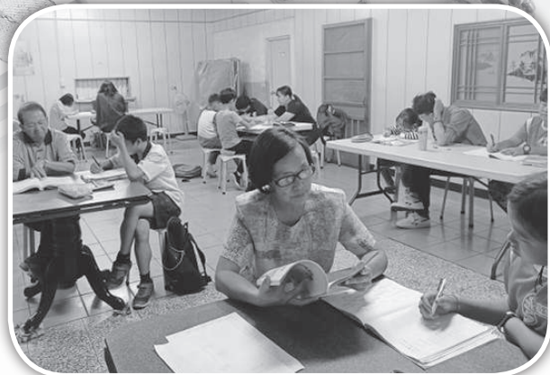
▲ Grace 夫婦來頭屋課輔班教學。