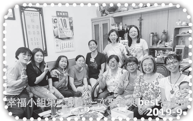
▲第二期幸福小組第一次聚會。