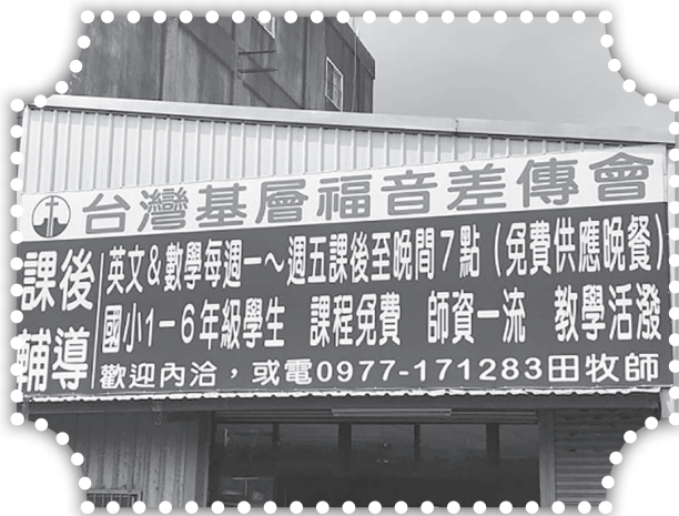
▲國小課輔班新教室的招牌。