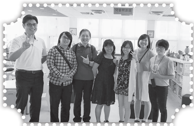
▲與康華飛颺團隊拜訪造橋圖書館。