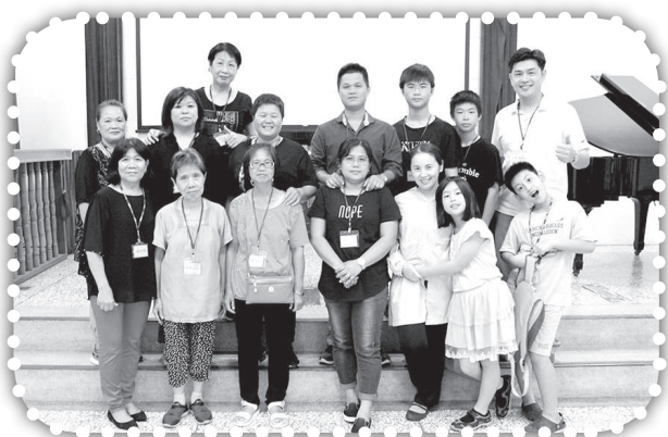
▲造橋教會參加福音聯盟靈修會。