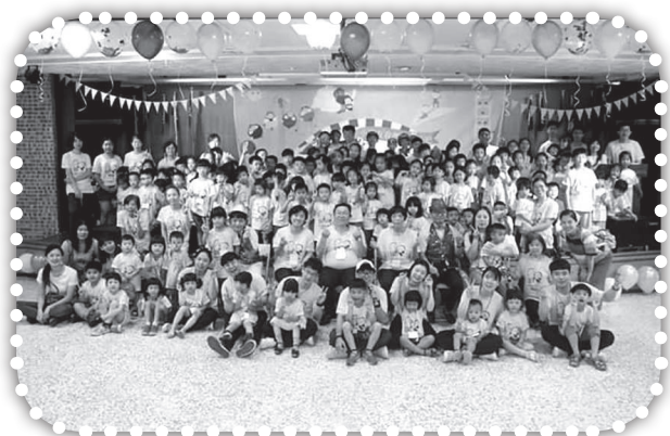
▲青年參與韓國福音營會。