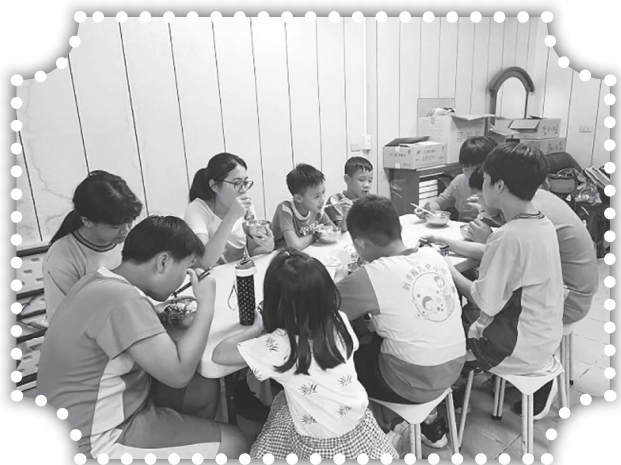
▲課輔班孩童吃晚餐。