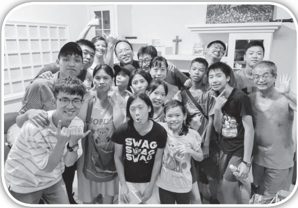
▲華岡團契福音遍傳服事同工在造橋。