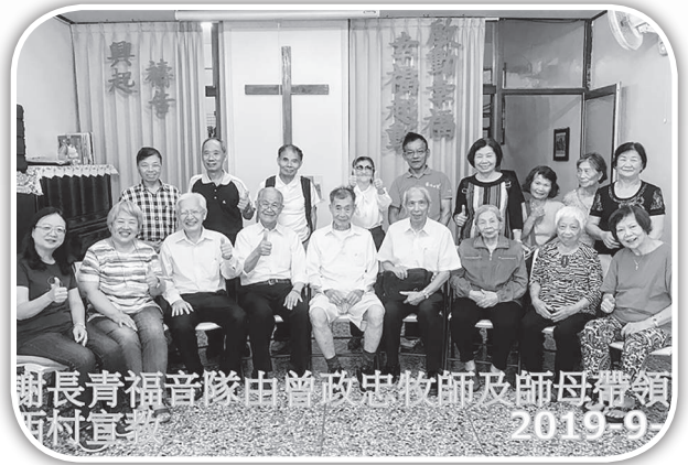
▲客家長青福音隊到大西村宣教。