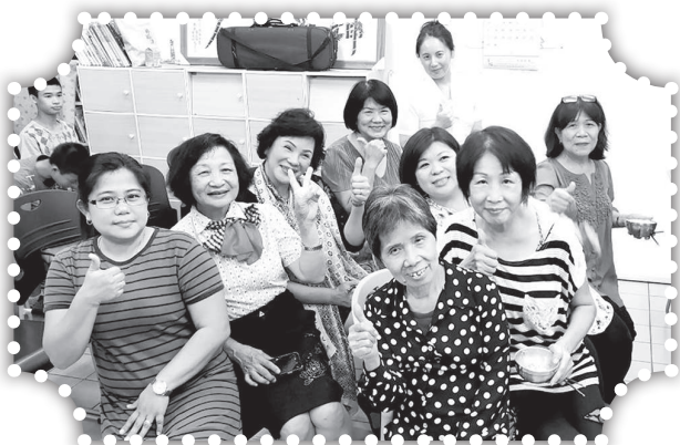
▲教會榮美的姊妹們。