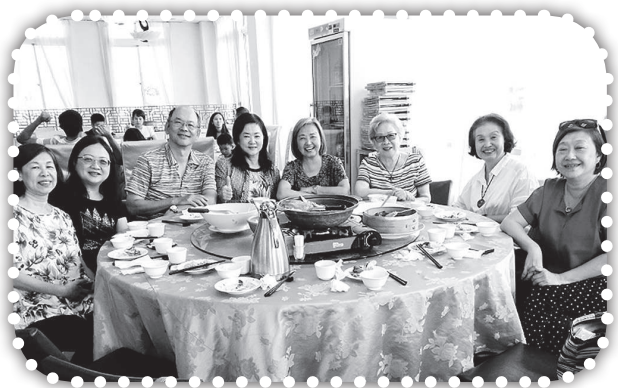
▲與俞媽的親友聚餐。