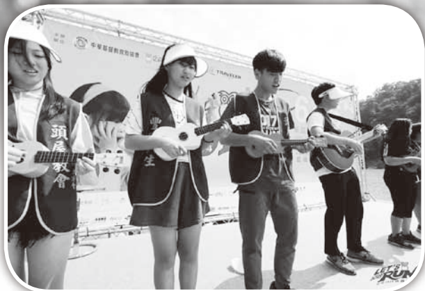
▲頭屋教會在新店碧潭表演烏克麗麗。