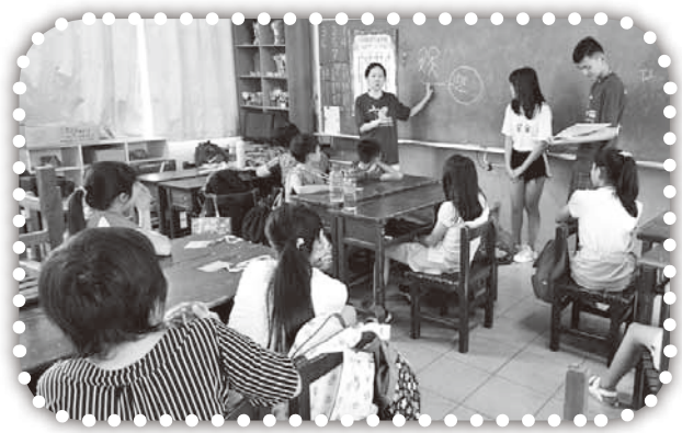
▲SOW短宣隊在明德國小。

1. 請為在營會中決志的孩子禱告。無論他們是否能順利進教會，讓他們心中福音的種子有人澆灌，至終能結出得救的果子來。