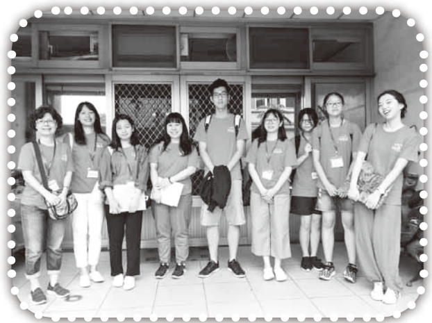
▲上海華商團契短宣隊在大西。