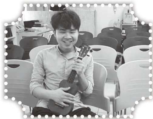
▲越南僑生在造橋教會。