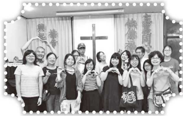
▲上海華商團契在大西國中舉辦英文營。