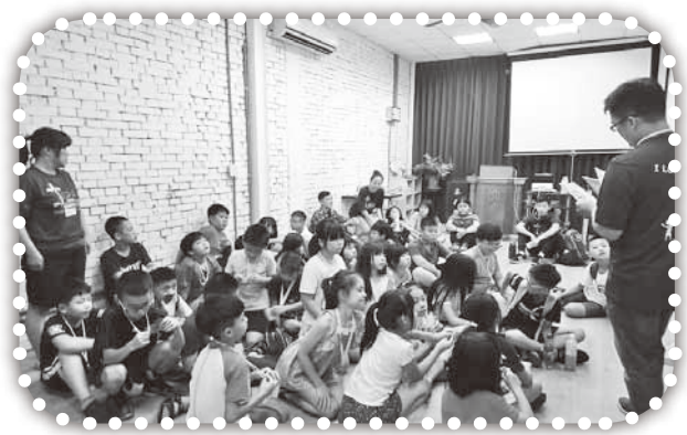
▲下午在頭屋教會活動。