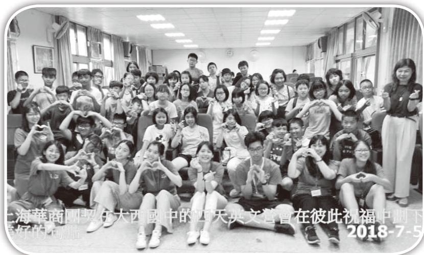
▲上海華商團契在大西國中的英文營。