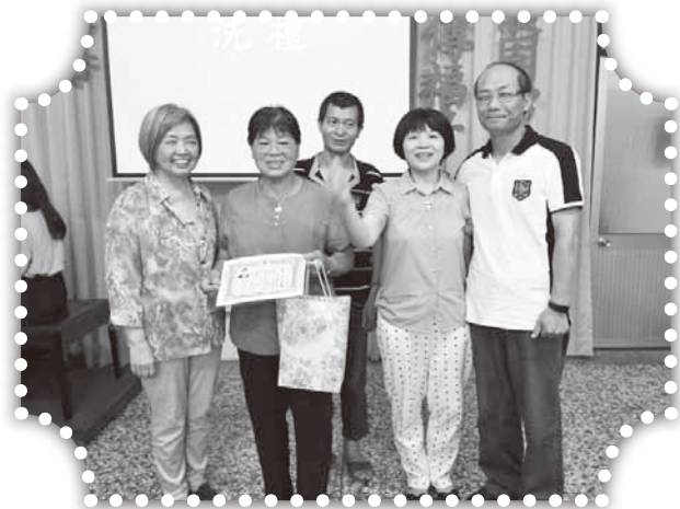
▲俞媽關心帶領的黃羅松妹媽媽受洗歸主。