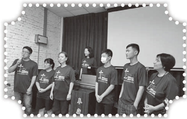
▲SOW短宣隊在頭屋教會。

2. 請繼續為國中和國小課輔班有足夠的老師，且各個都是盡責、有愛心，能給學生做榜樣的老師禱告。