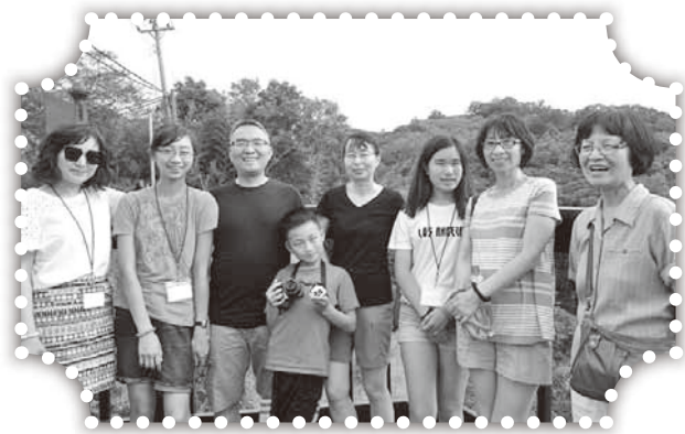
▲康郡教會短宣對隊在頭屋。