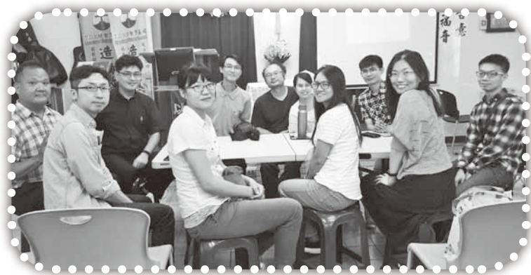
▲北門聖教會社青小組來訪。