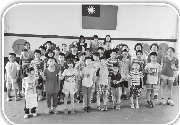
▲康郡教會短宣在明德國小。