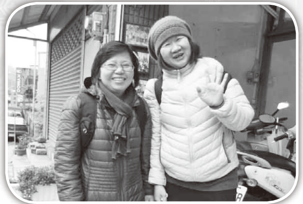
▲美美及櫻玲兩位姐妹多年協助大西兒童事工。