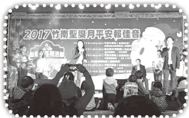
▲新加坡團隊唱聖誕組曲。