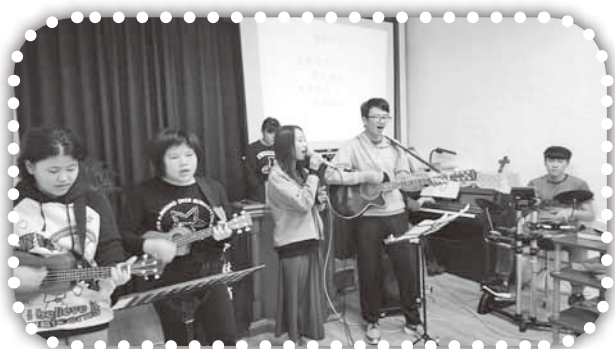
▲越來越老練的敬拜團。