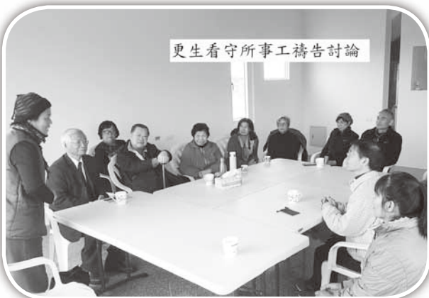
▲參加更生事工禱告會。