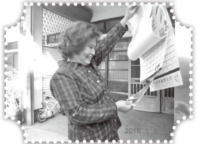
▲以福音月曆祝福村民。