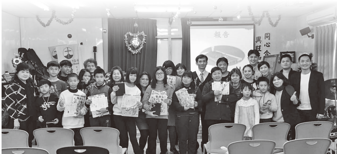
▲聖誕節受洗禮拜合照。