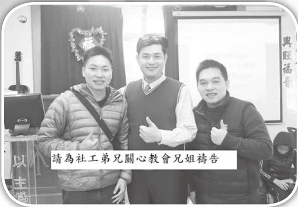
▲社工及慕道友訪問造橋教會。