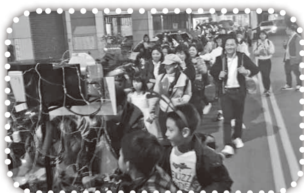
▲聖誕節在竹南遊行。