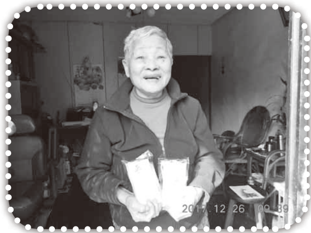
▲收到聖誕糕的村民笑顏逐開。