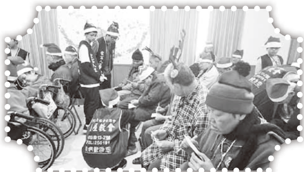
▲與老人家一起玩賓果遊戲。