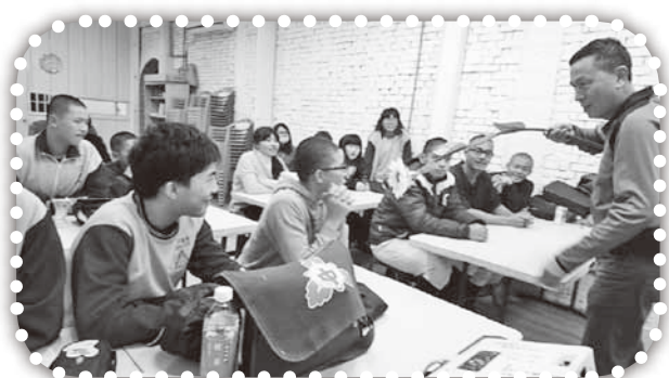
▲在課輔班表演魔術。