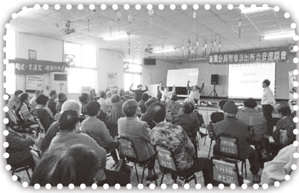
▲在明德活動中心表演魔術。