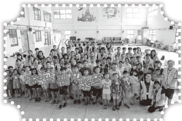
▲暑假的《飛颺快樂夢想營》。