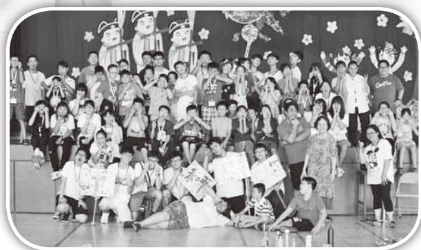
▲三峽麗景教會與頭屋教會青少年。