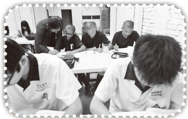
▲認真讀書的課輔班學生。