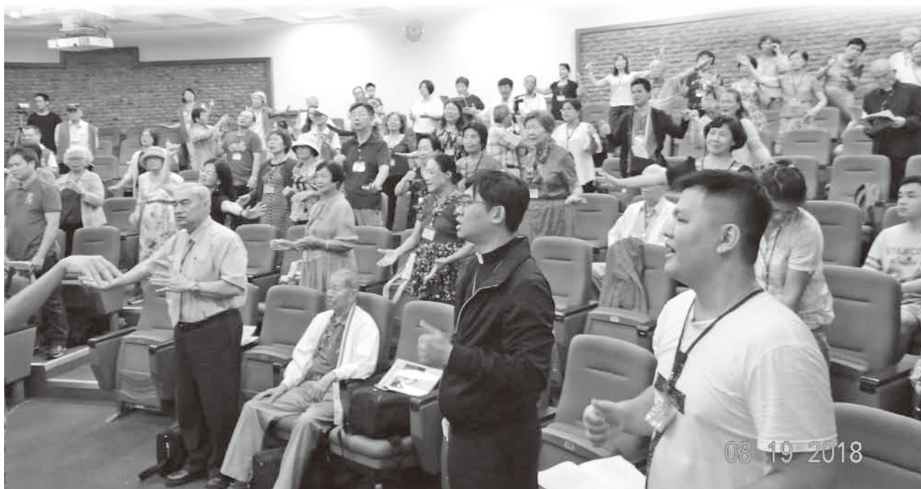
▲參加福音聯盟信徒靈修會。

最後，也請繼續為我們代禱，我們仍然繼續仰望我們的上帝，相信祂的應許絕不落空，教會現在也在學習幸福小組、教會培育系統，求主來帶領我們，使我們能夠更健康、更成