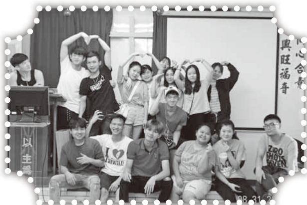
▲造橋教會的越南僑生。