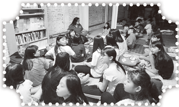
▲暑期營會孩子在教會過夜。

這是我們頭屋教會第一次嘗試由青少年承擔這些事工，由於他們本身還在情緒多起伏的年紀，就要求他們學會如何觀察、安排、協調、處理等服事上的需要，真的是不容易。請多為我及他們禱告，希望在「門徒訓練」的過程中，滿有上帝的憐憫恩慈、並加添屬天的智慧能力，使頭屋教會能為主做見證，成為人人是「主耶穌門徒」的教會！