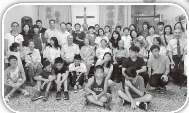
▲大西教會與北門聖教會肢體合影。