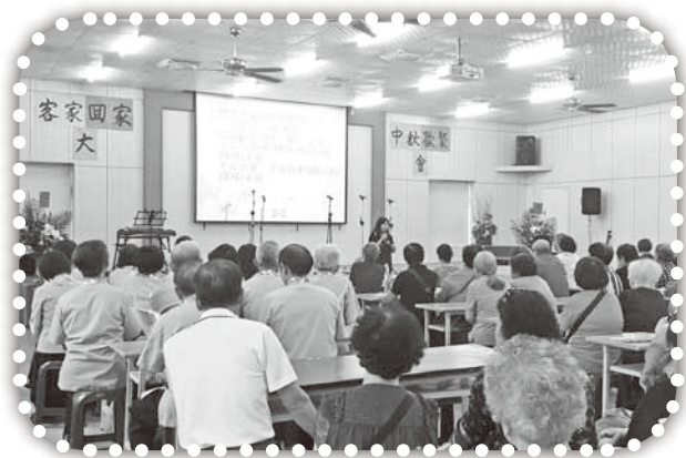
▲參加《客家回家》中秋大會。

3.請為聖誕節的籌備禱告，求主幫助我們能藉著聖誕季節傳揚福音，有更多美好的果效。