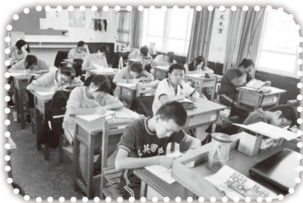
▲國中《得勝者課程》開始了。