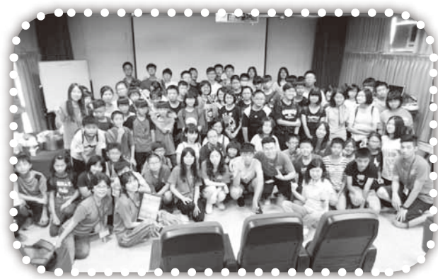
▲上海華商團契短宣隊在大西國中。