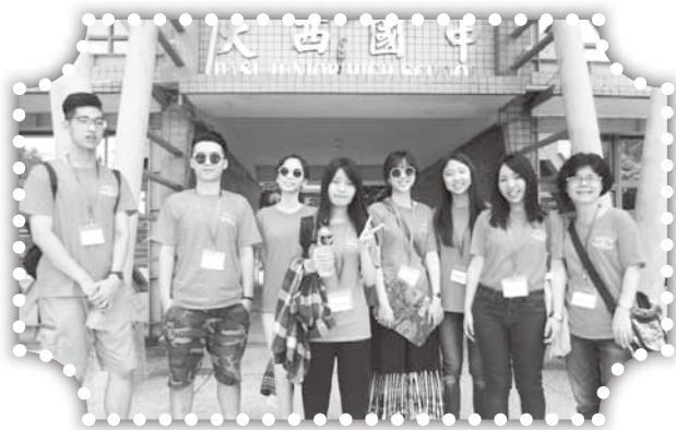
▲上海華商團契短宣隊在大西服事。

誠如在看守所中的朋友，相信當他們在接受耶穌的那一刻開始，他們的生命就已經開始不一樣了。感謝神，那天有一半的女受刑人願意成為神的兒女，相信下次再見面時，是在獄所之外。