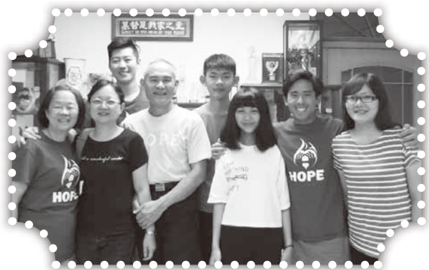
▲探望聖地牙哥雅歌堂短宣隊。