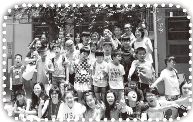
▲康郡短宣隊與學生合照。