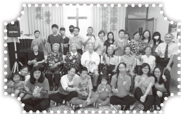
▲張醫師及姐姐主日會後留影。