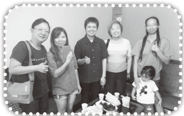
▲俞媽與同工們關心傳姐妹。