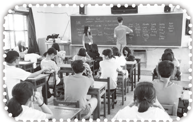
▲短宣隊在營會教學。