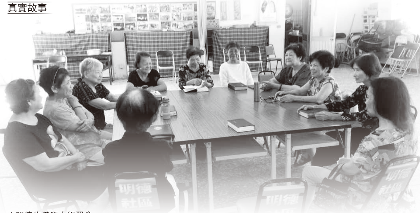
▲明德佈道所小組聚會。