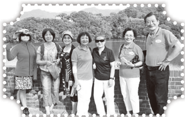
▲拿撒勒神學院同工來訪。