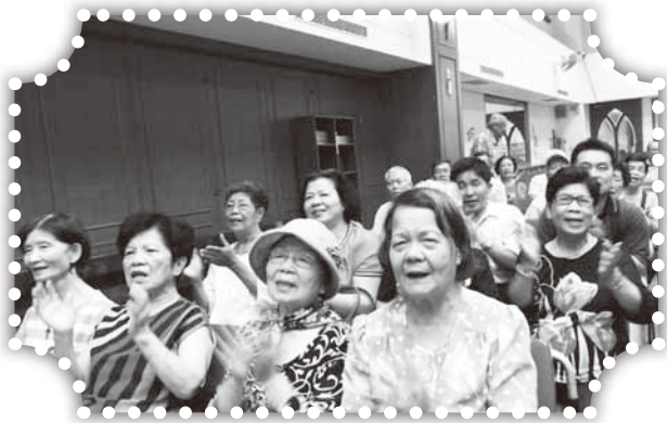
▲頭屋的肢體參加「客家回家」。