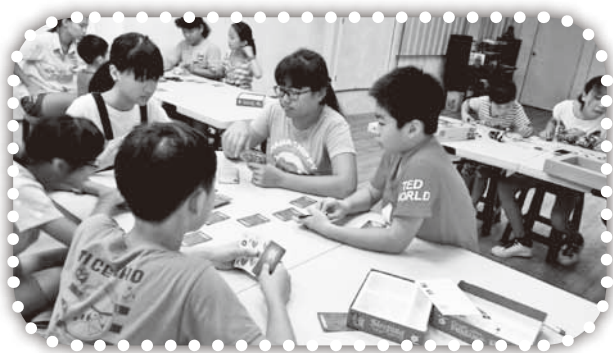
▲孩子們在教會玩桌遊。