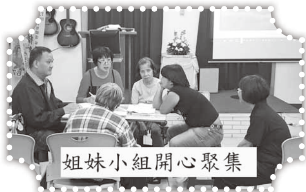
姐妹小組開心聚集