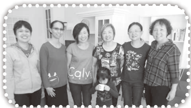
▲俞媽的女兒到尖下里看望媽媽。