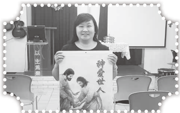
▲阿珠姐愛主跟隨主。