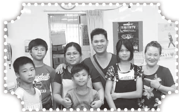
▲吳媽媽一家都來敬拜主。