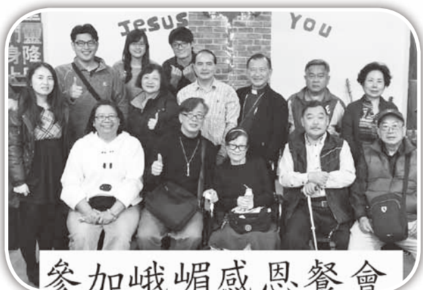
▲基福第一個教會——峨眉福音中心感恩餐會。