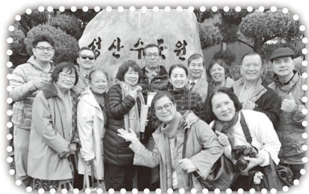
▲參加韓國使命者特會。