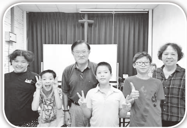
▲美國南灣廖長老來訪。