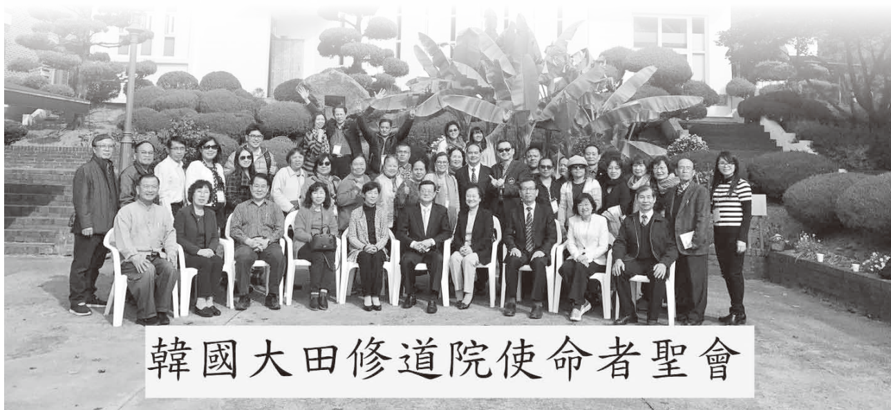
韓國大田修道院使命者聖會

最後也請為十二月的聖誕聯合節慶禱告，將有新加坡四位隊員特別飛過來協助，很感動他們的付出，願神賜福彼此，堅立我們手中的工作，阿們。