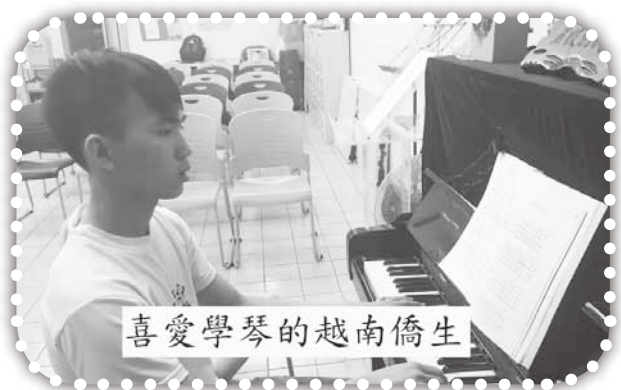
喜愛學琴的越南僑生